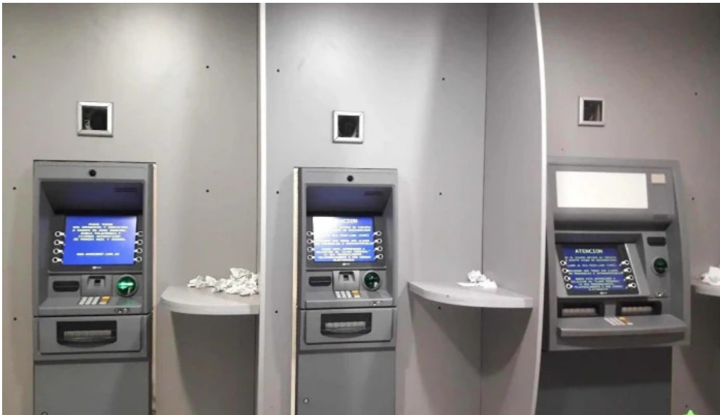
Banco santa fe instagram