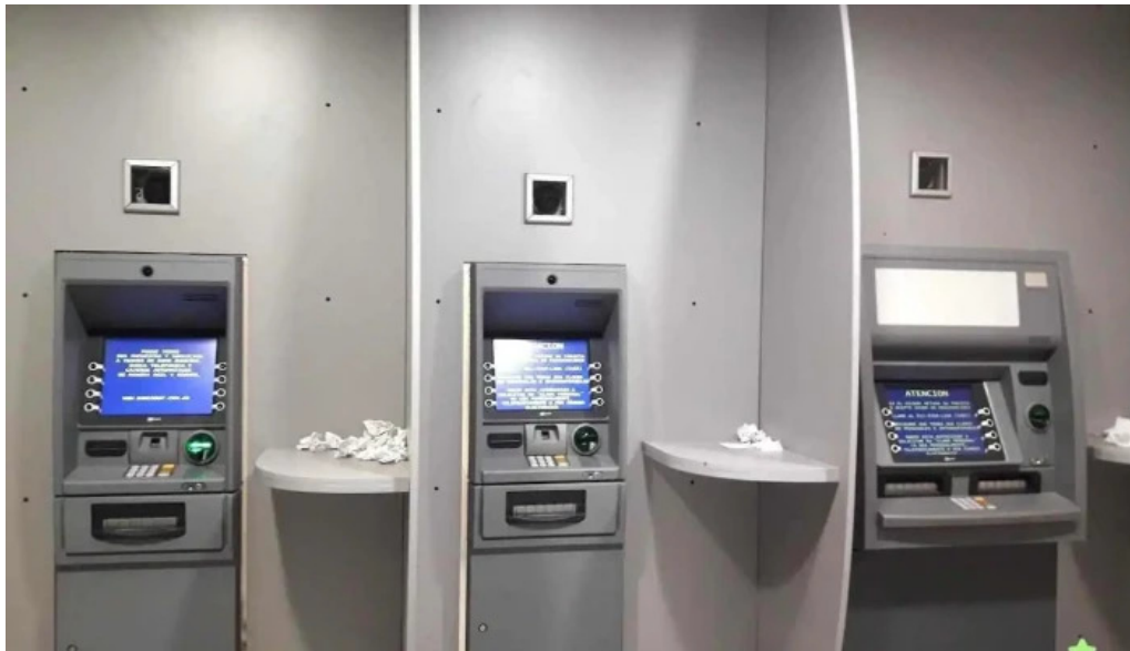
Banco santa fe ceres