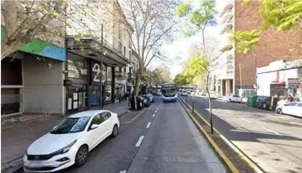
Provincia microcreditos donde