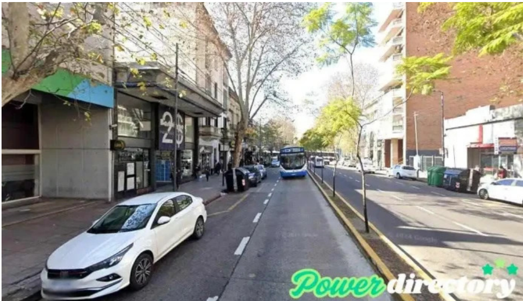
Provincia microcreditos cdad autonoma de buenos aires