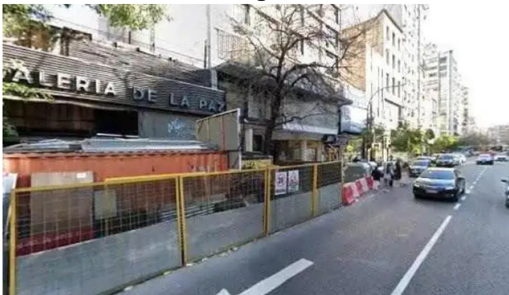
Creditos si zona