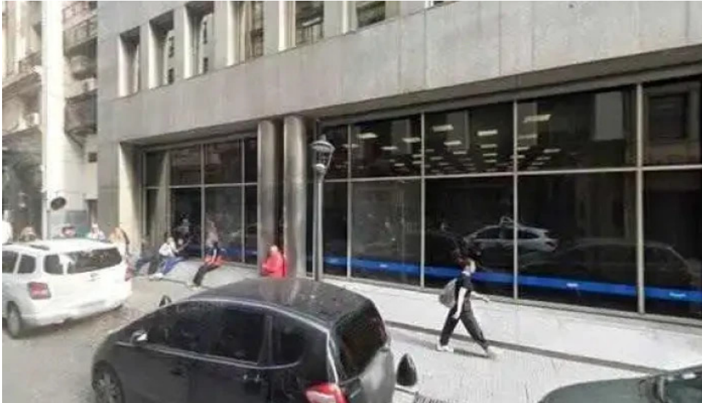
Buenos aires credits prestamos personales horario