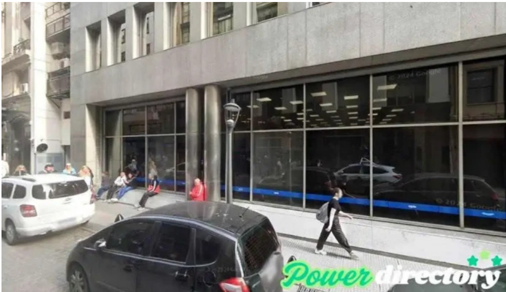
Buenos aires credits prestamos personales cdad autonoma de buenos aires