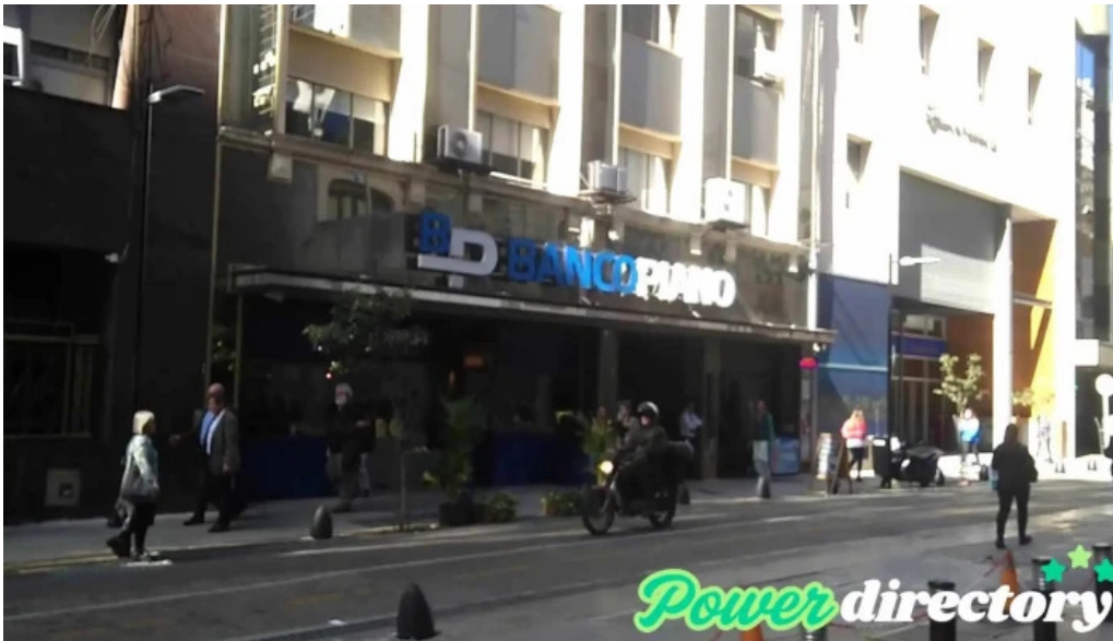
Banco piano videos