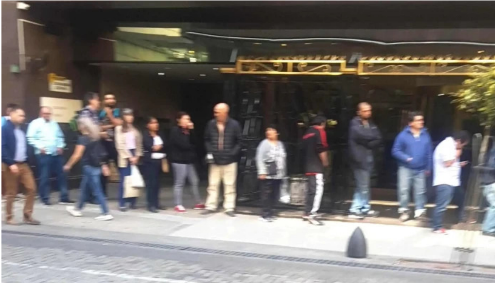
Banco piano descuentos