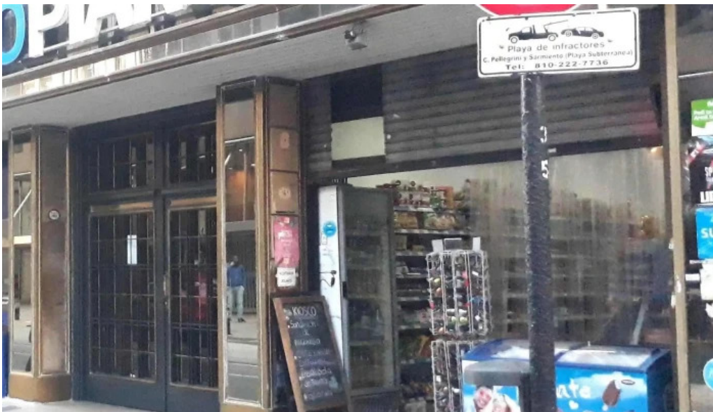
Banco piano promocion