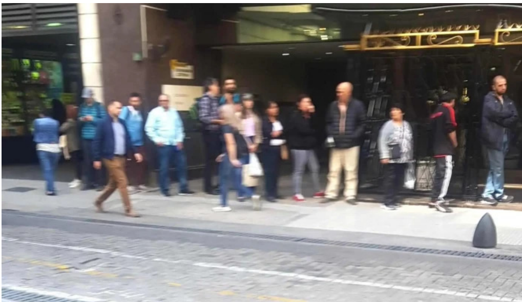
Banco piano ubicacion