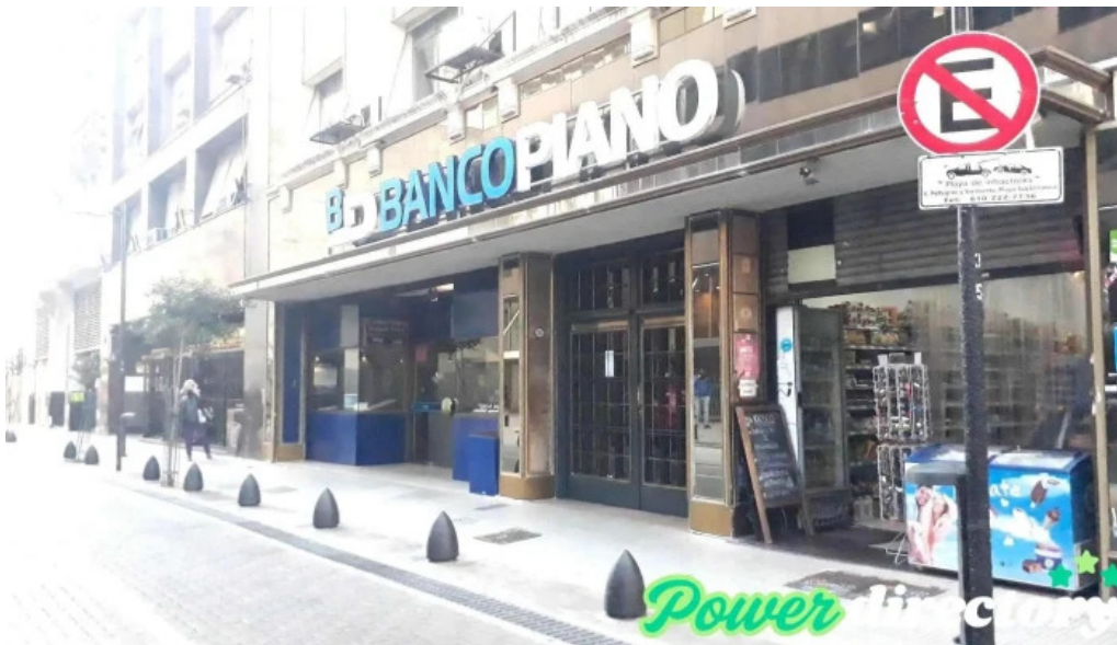
Banco piano exterior