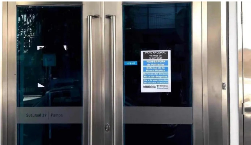
Banco ciudad exterior