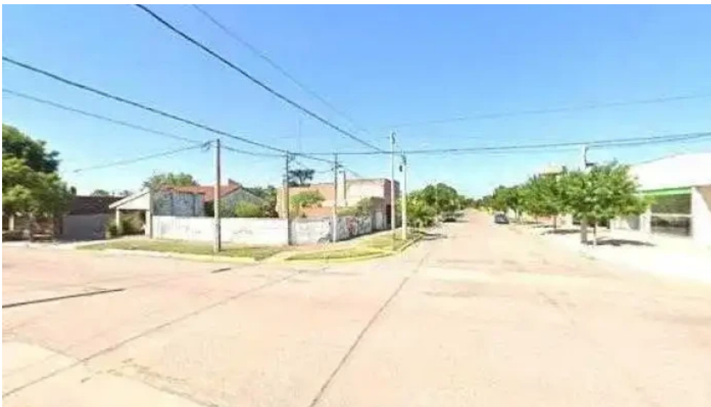
Banco de la pampa catrilo numero