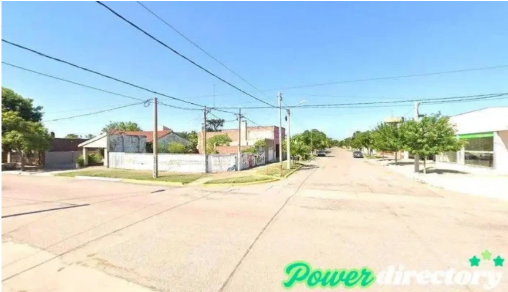
Banco de la pampa catrilo catrilo