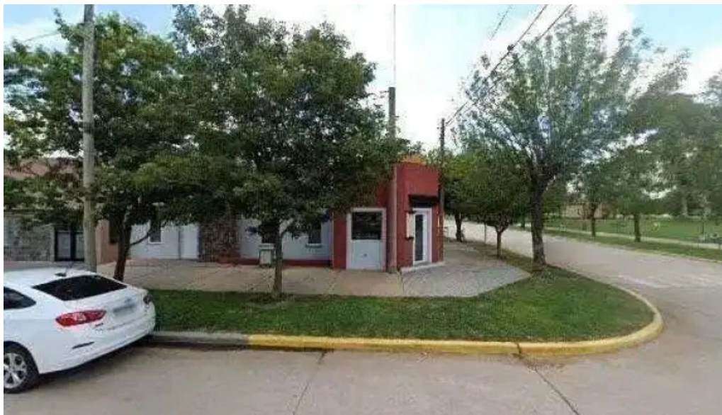
Banco provincia de cordoba abierto ahora