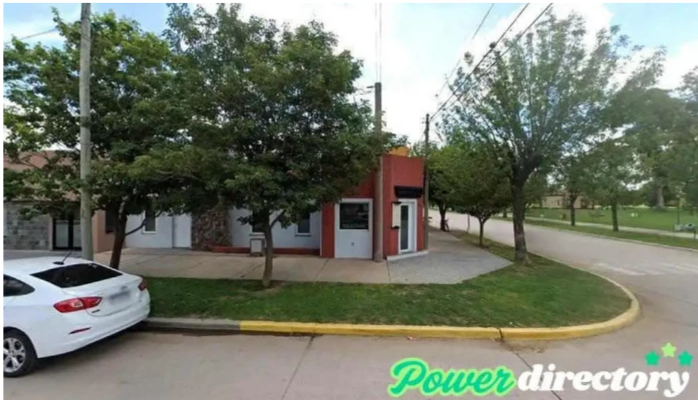
Banco provincia de cordoba carrilobo