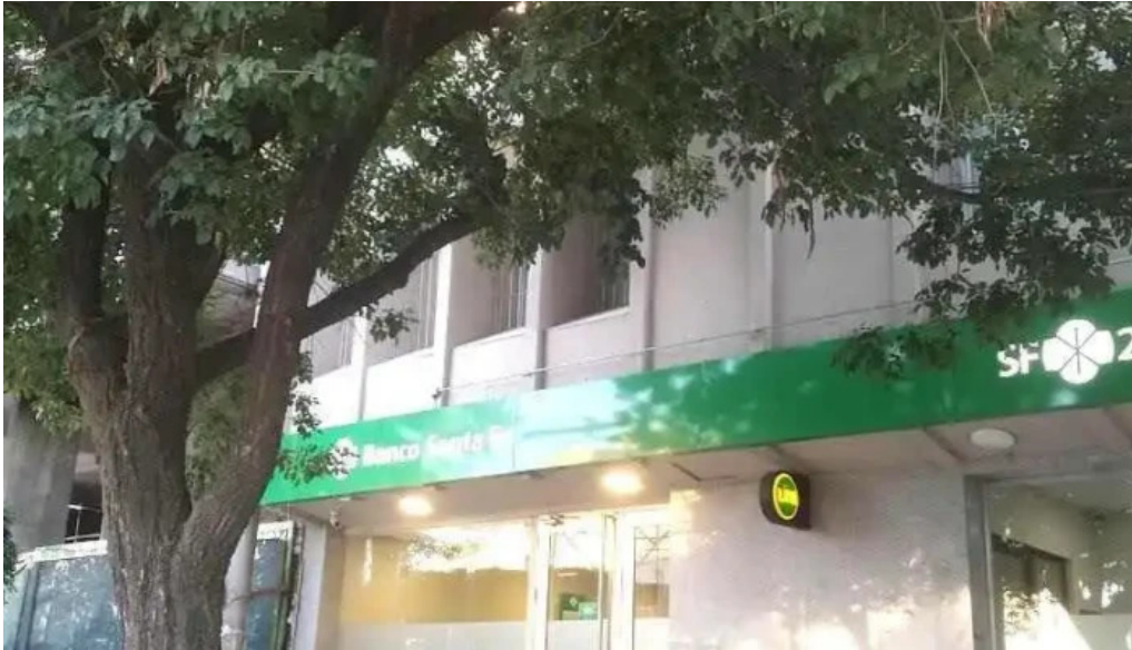
Banco santafe carcarana