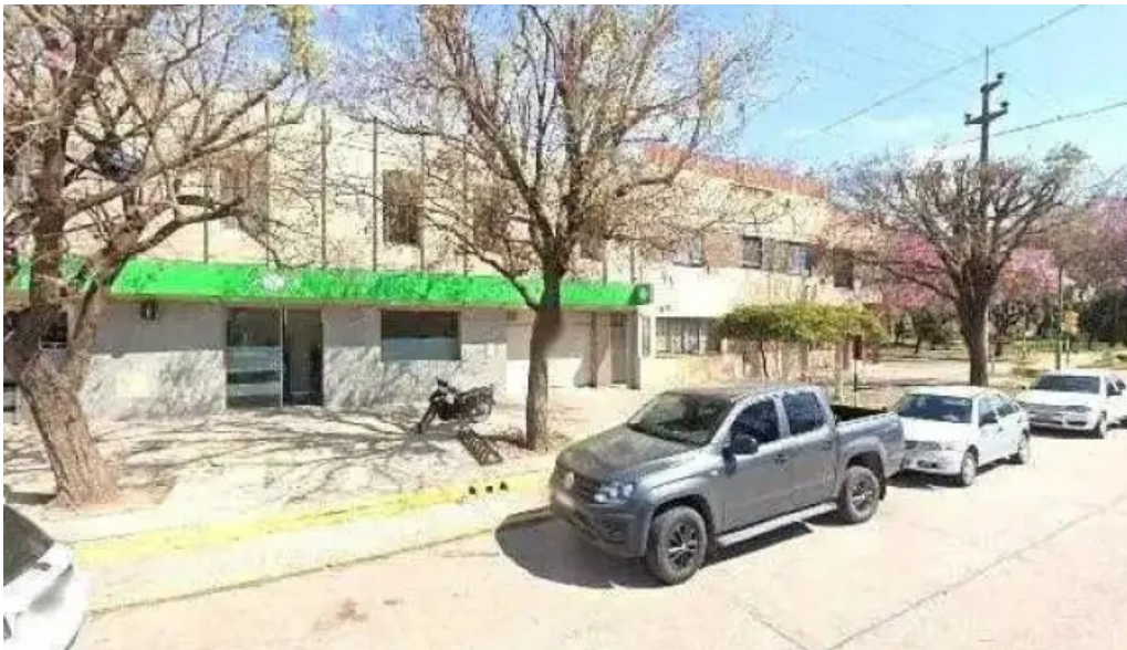
Banco santafe zonadeg