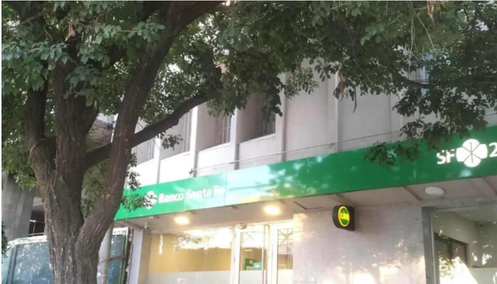
Banco santafe zona