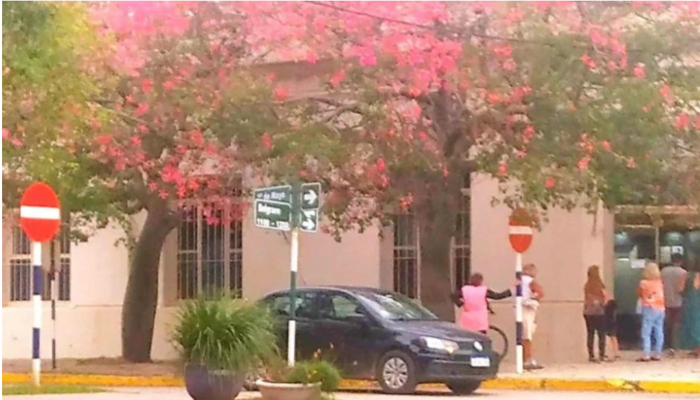
Banco de la nacion argentina carcarana