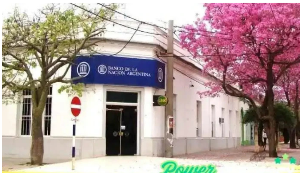
Banco de la nacion argentina exterior