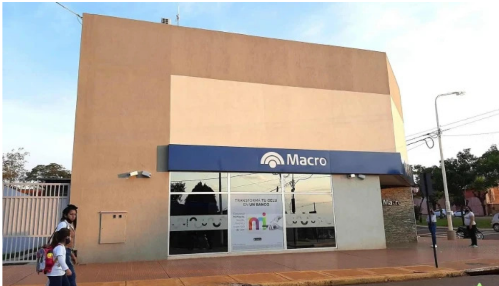
Sucursal candelaria banco macro donde