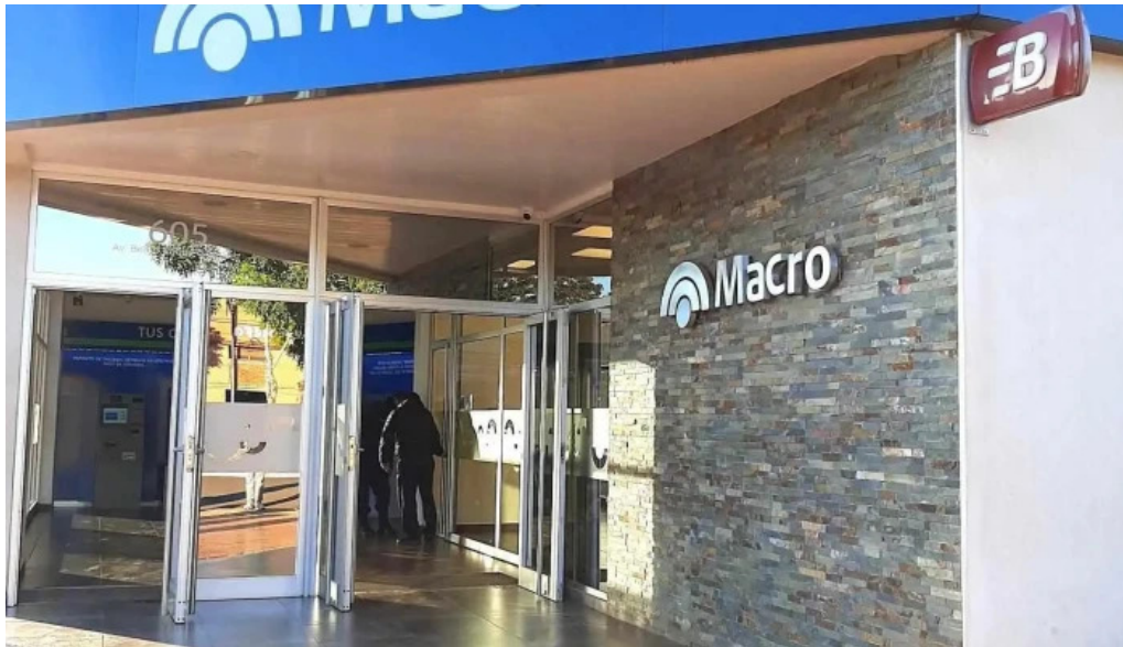
Sucursal candelaria banco macro exterior