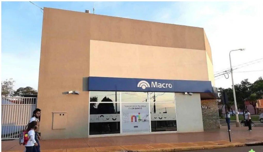
Sucursal candelaria banco macro candelaria