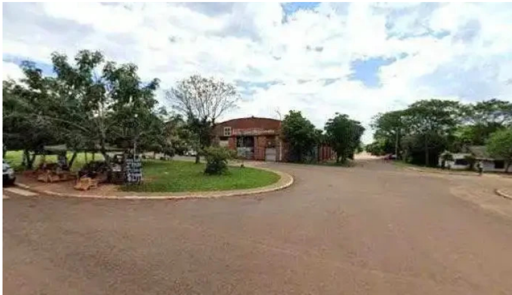
Sucursal candelaria banco macro dondedeg