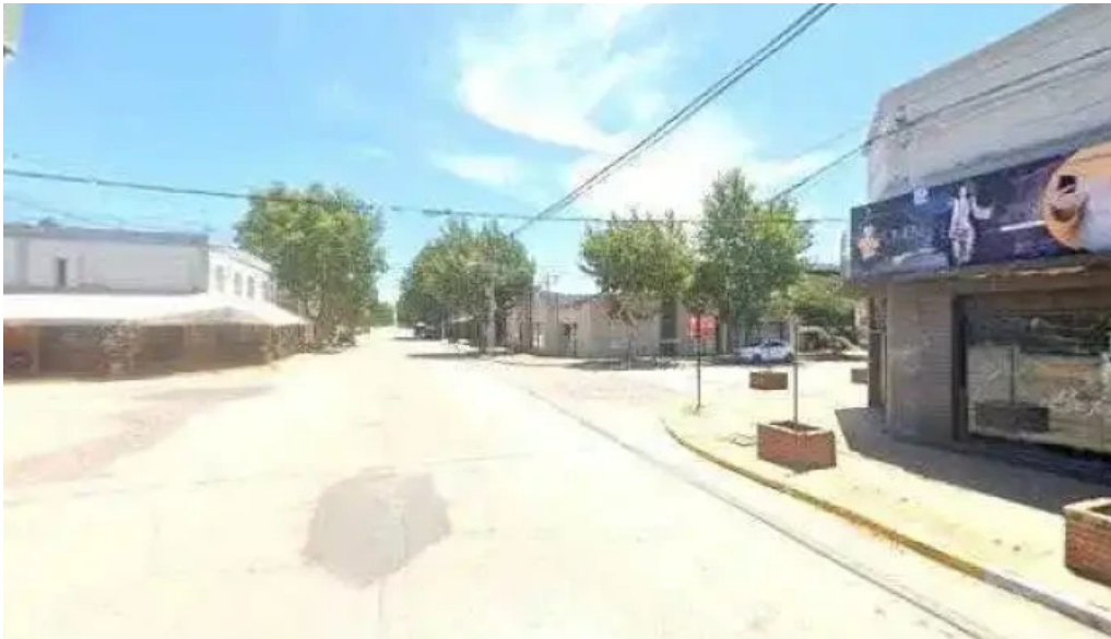
Banco de la provincia de cordoba telefono