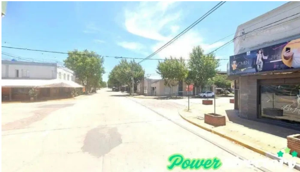
Banco de la provincia de cordoba canals