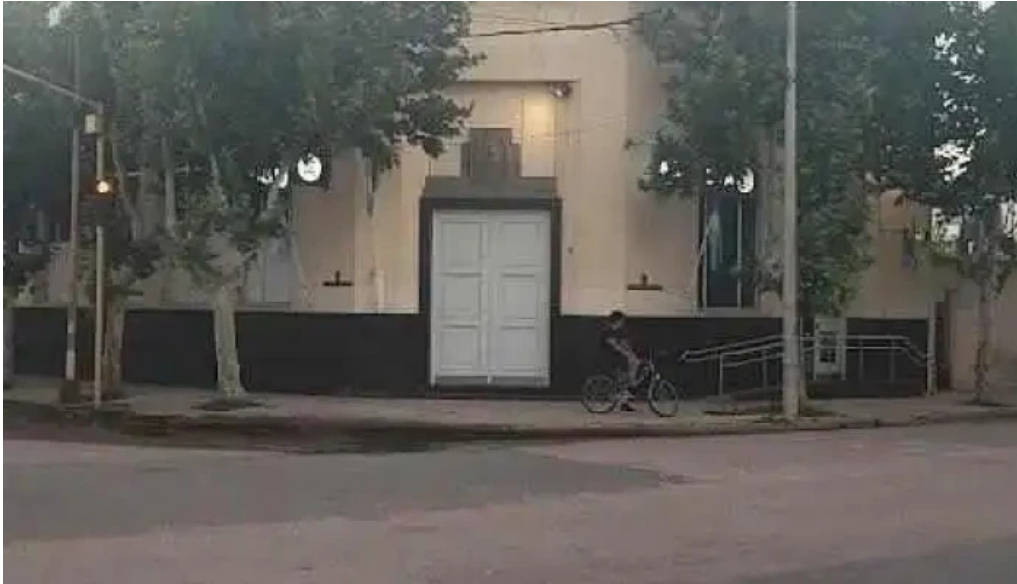
Banco de la nacion argentina canals