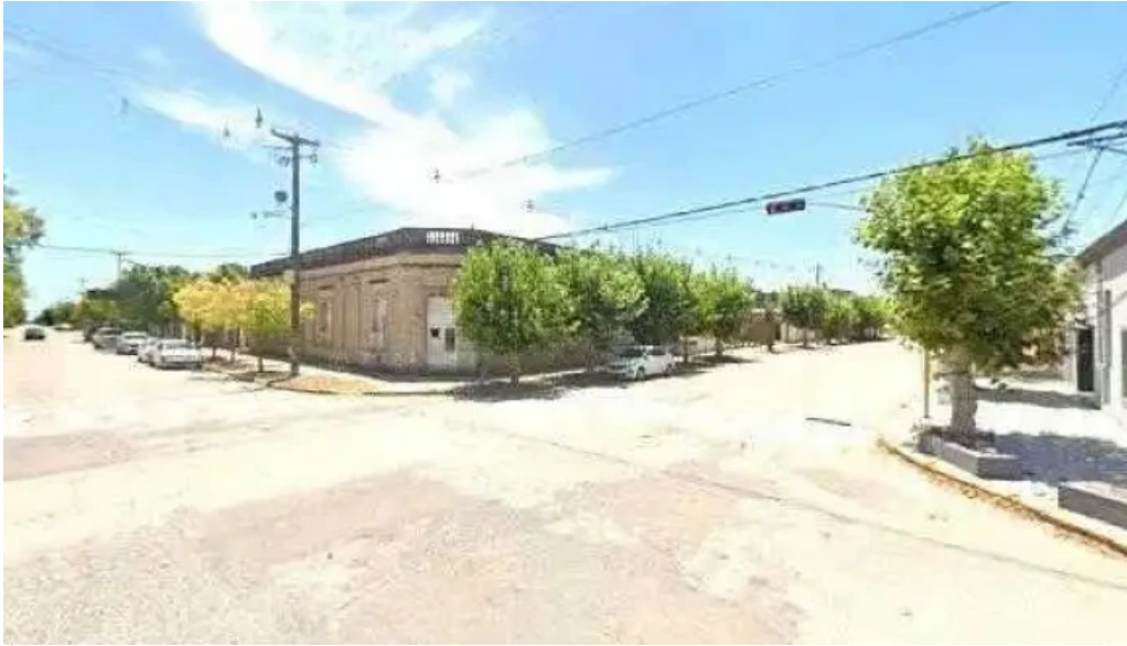
Banco de la nacion argentina como llegardeg