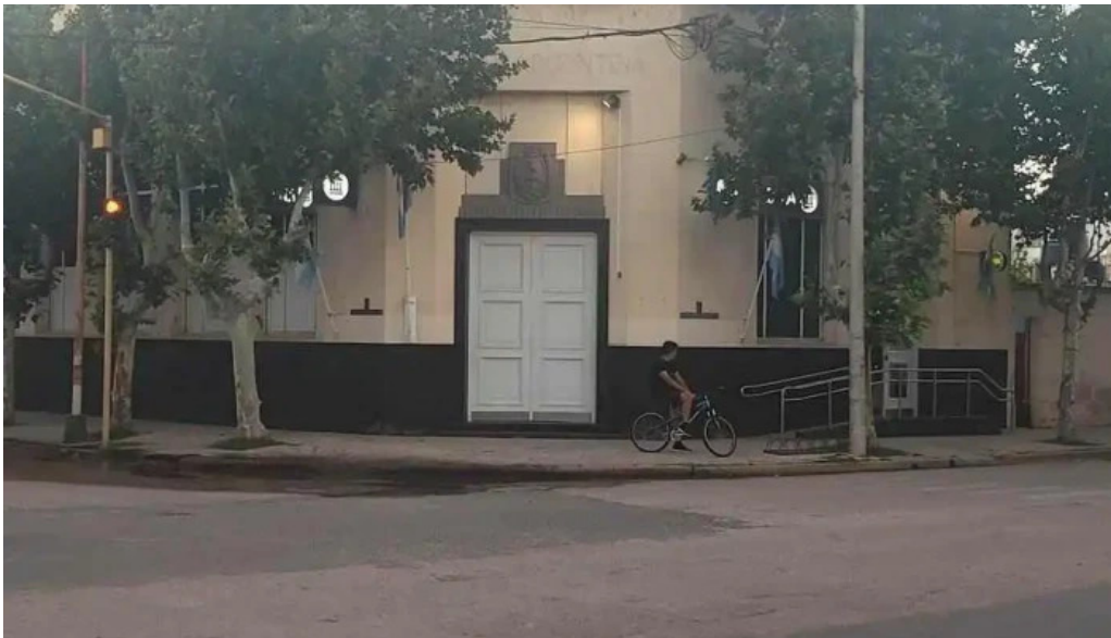
Banco de la nacion argentina como llegar