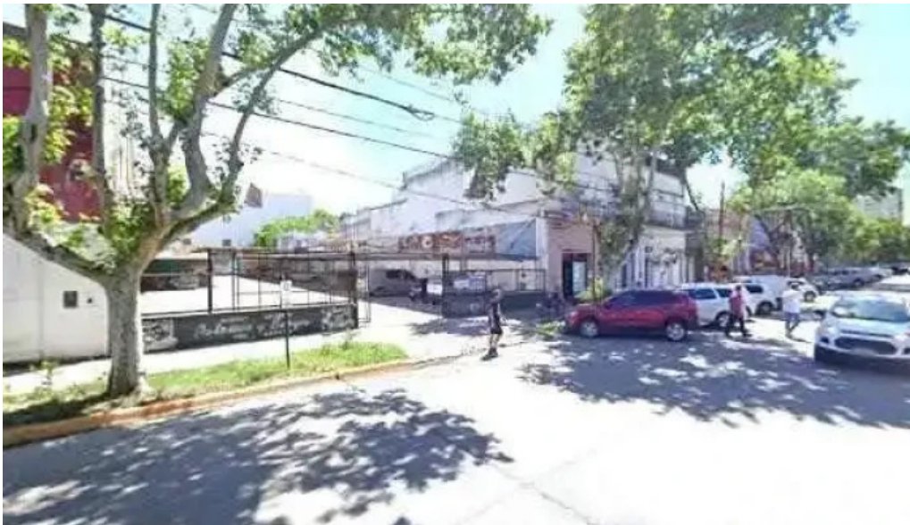
Filial canada de gomez catalogo