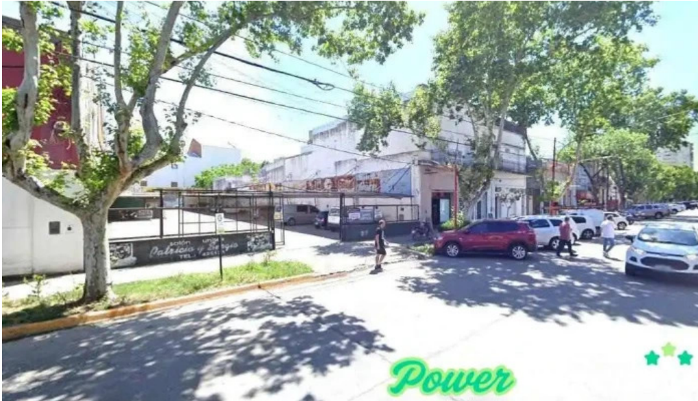
Filial canada de gomez canada de gomez