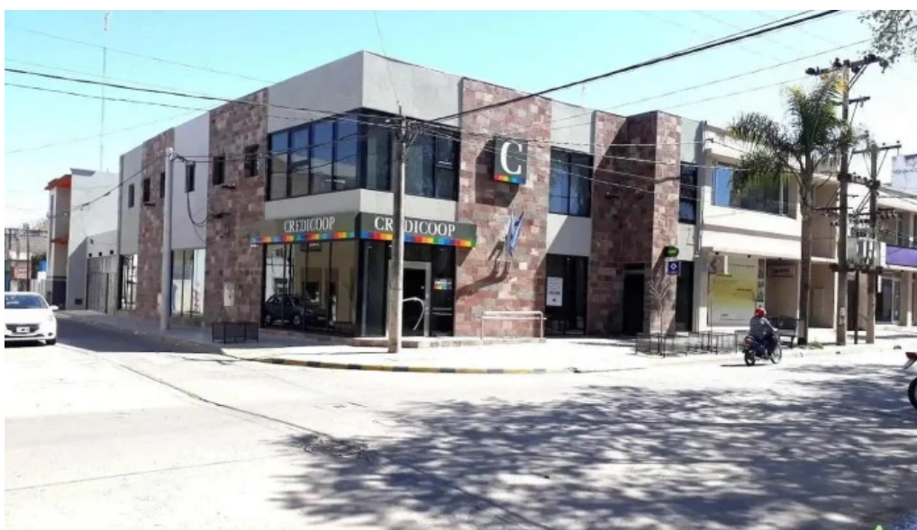
Banco credicoop canada de gomez