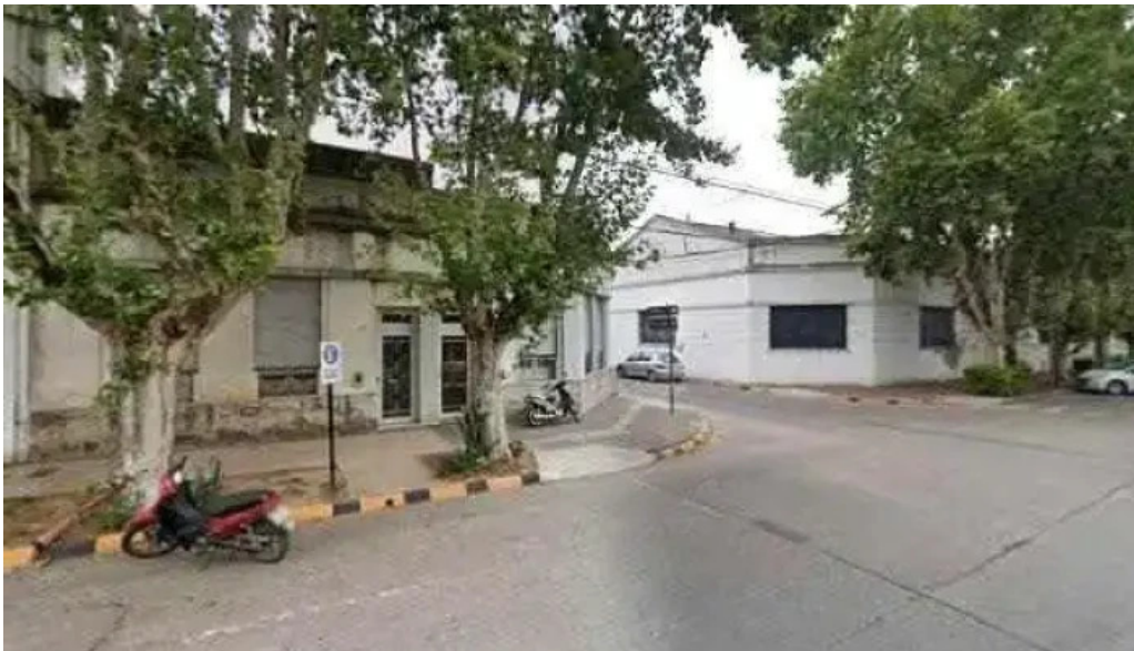
Banco credicoop descuentosdeg