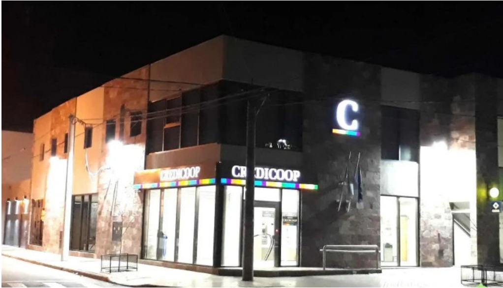
Banco credicoop exterior