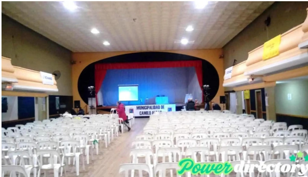
Macro sucursal camilo aldao fotos