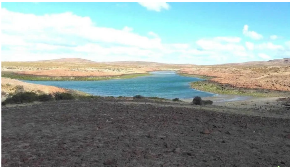
Banco del chubut camarones