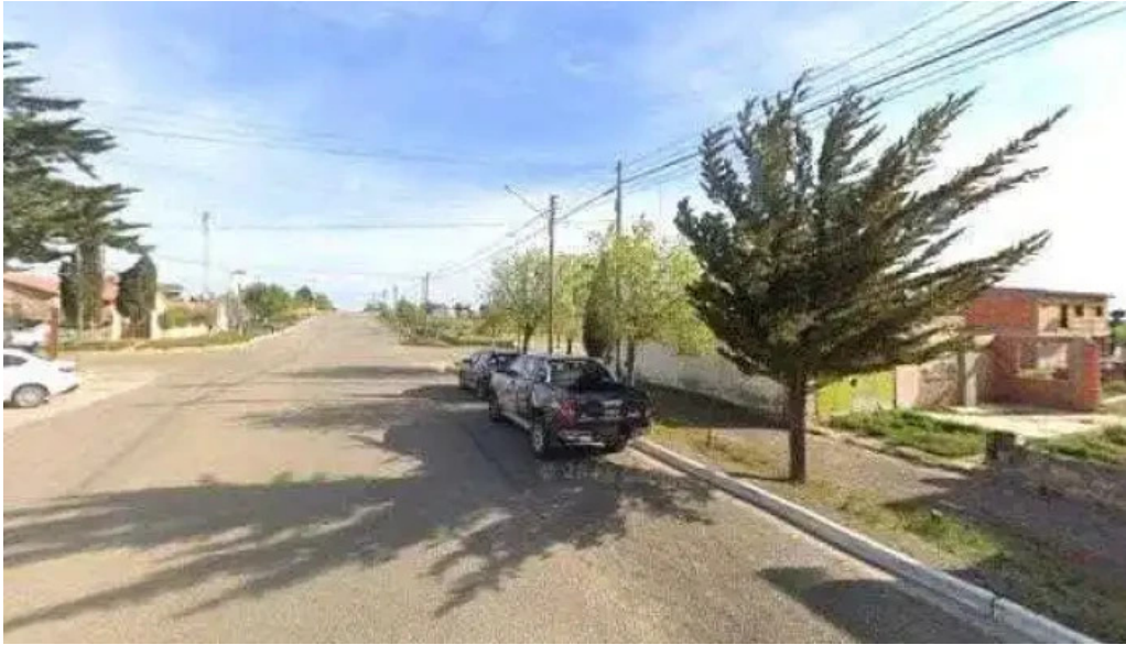
Banco del chubut como llegardeg