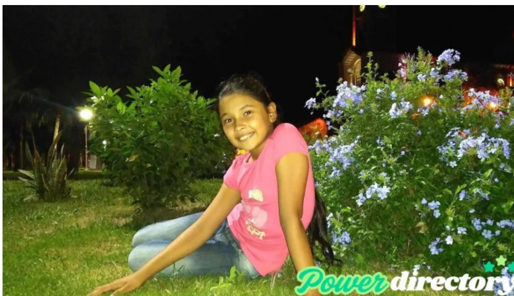
Banco santafe calchaqui