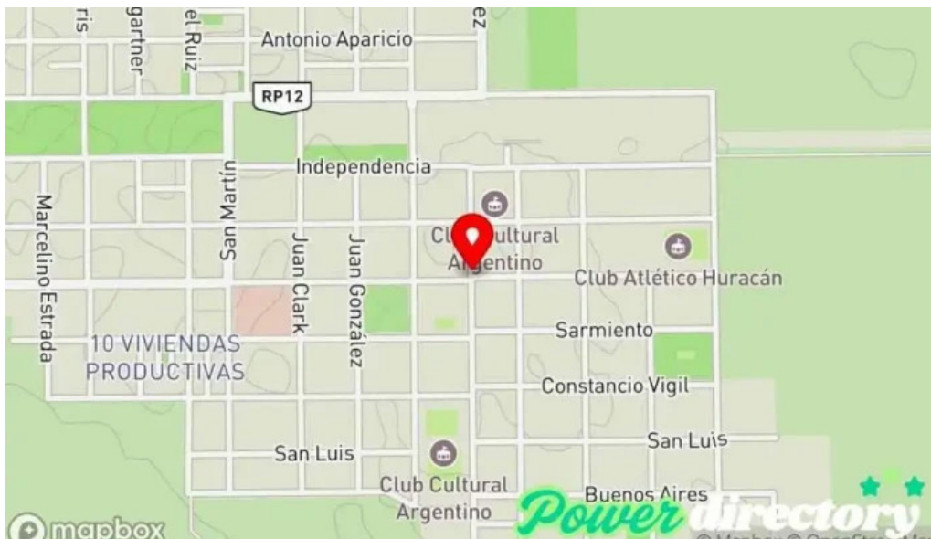
Banco de la nacion argentina mapa