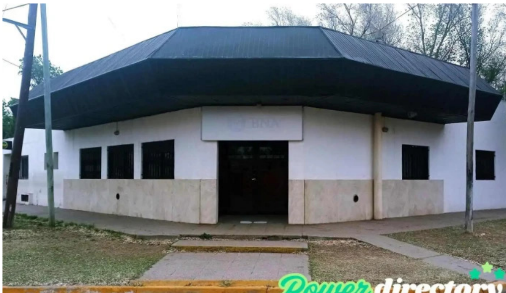
Banco de la nacion argentina buena esperanza