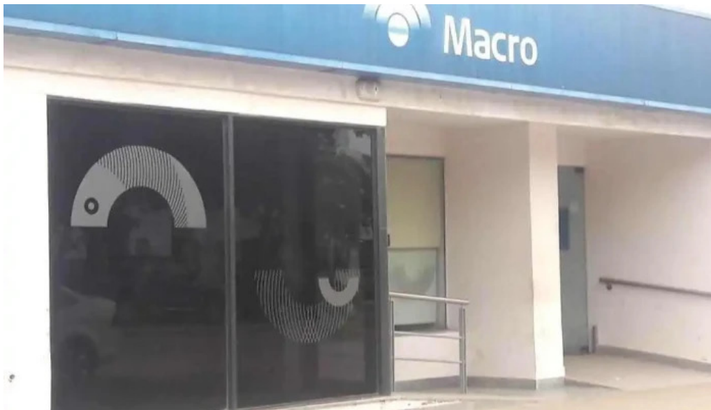
Macro sucursal brinkmann brinkmann