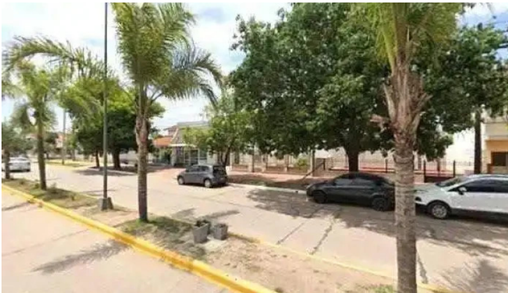
Macro sucursal brinkmann numerodeg