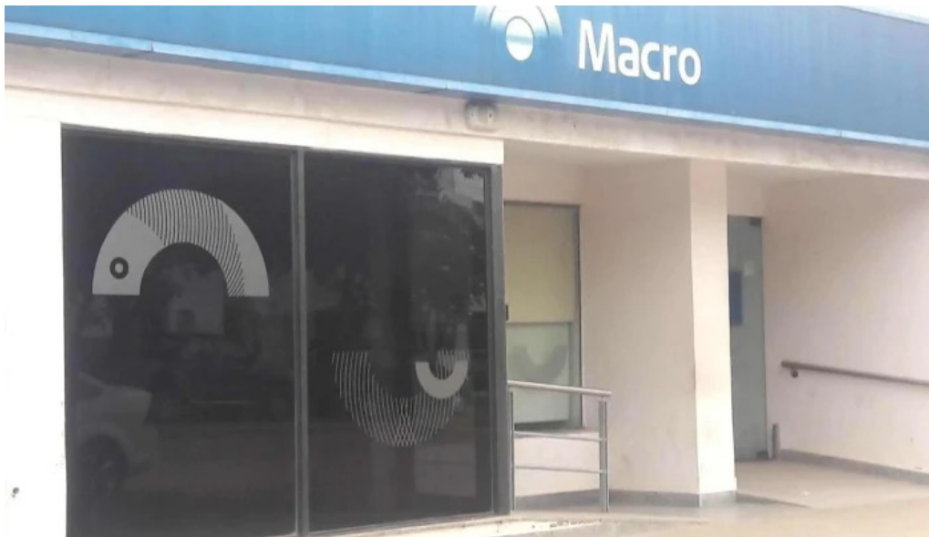
Macro sucursal brinkmann numero