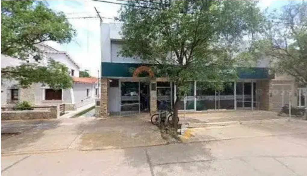
Banco cordoba direccion