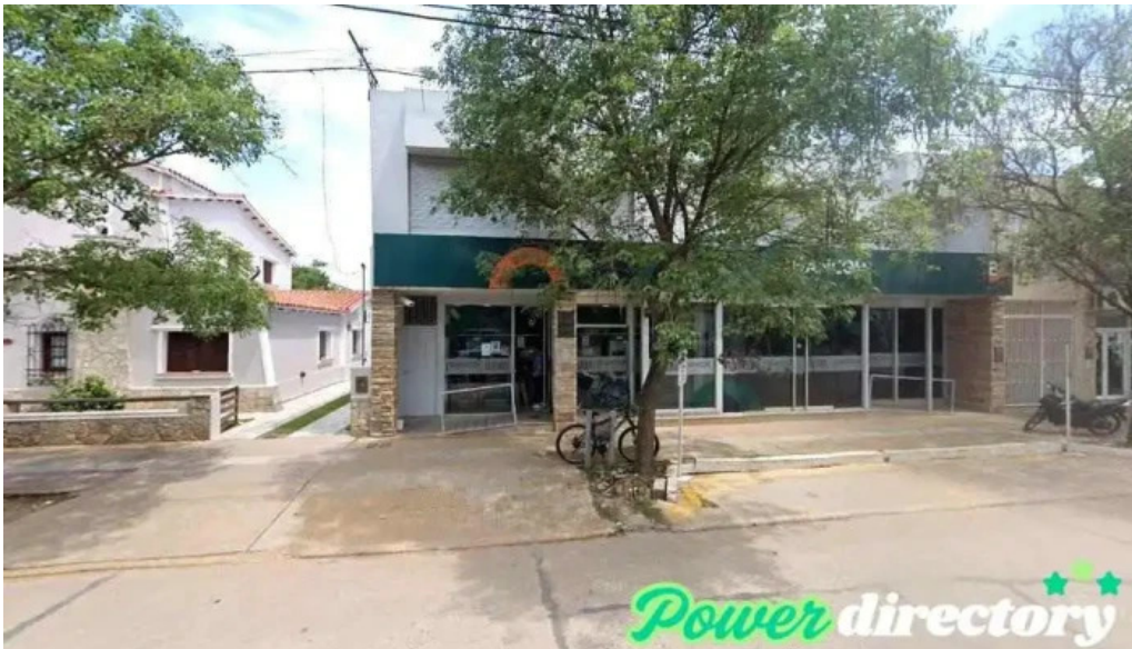
Banco cordoba brinkmann