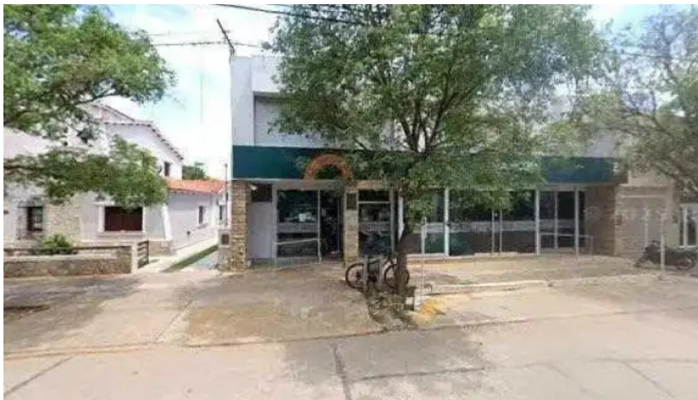
Banco cordoba direcciondeg