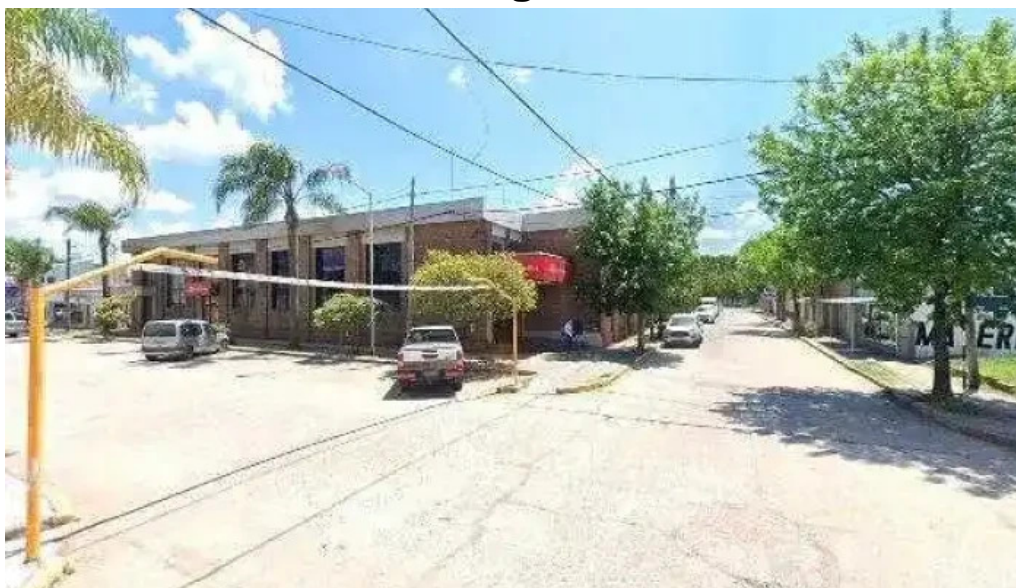
Banco entre rios videos