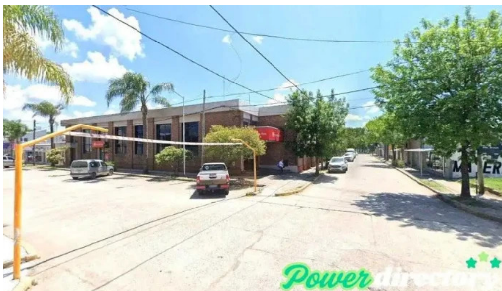
Banco entre ríos bovril