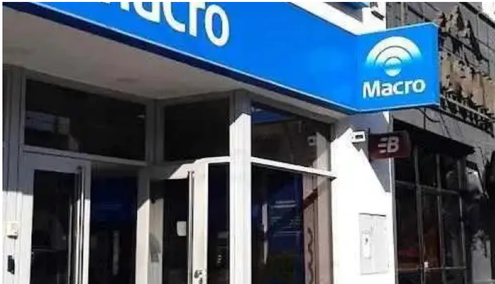
Macro sucursal bell ville bell ville