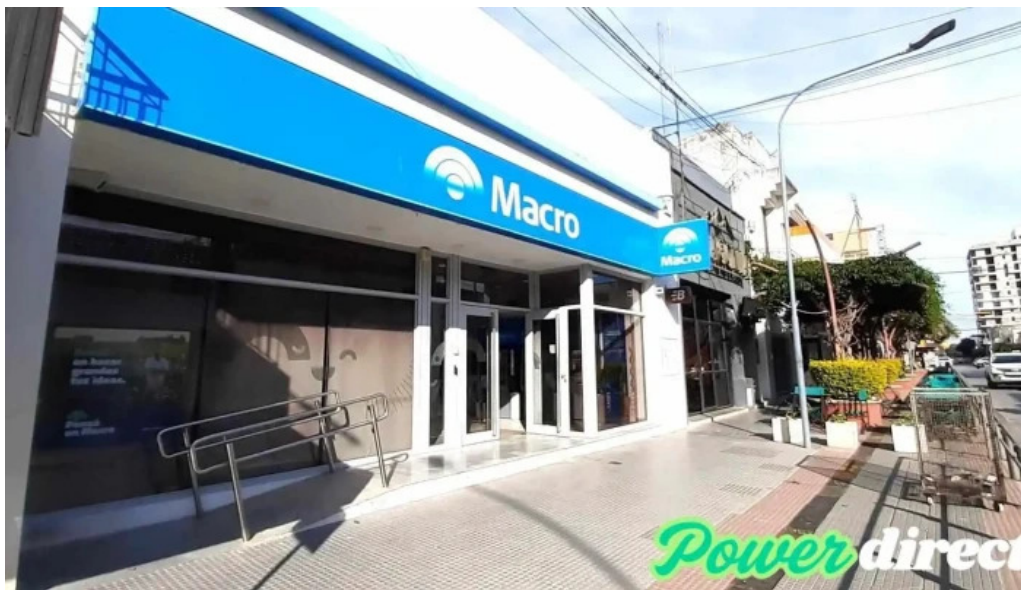
Macro sucursal bell ville exterior