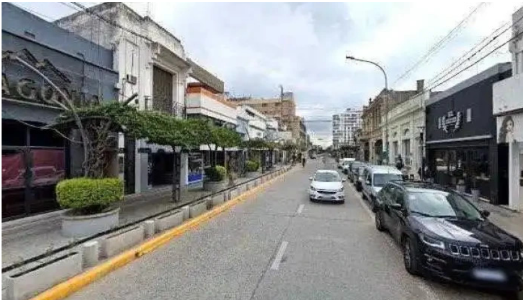
Macro sucursal bell ville videosdeg