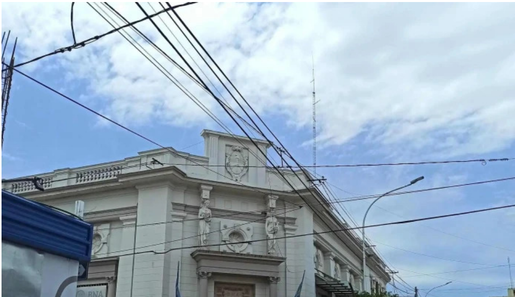
Banco de la nacion argentina bell ville