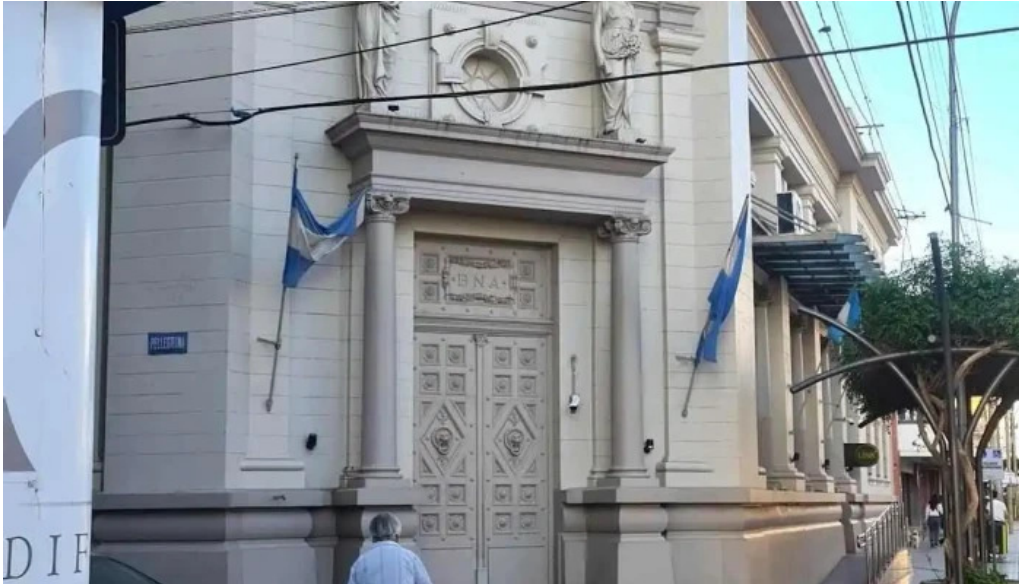
Banco de la nacion argentina catalogo