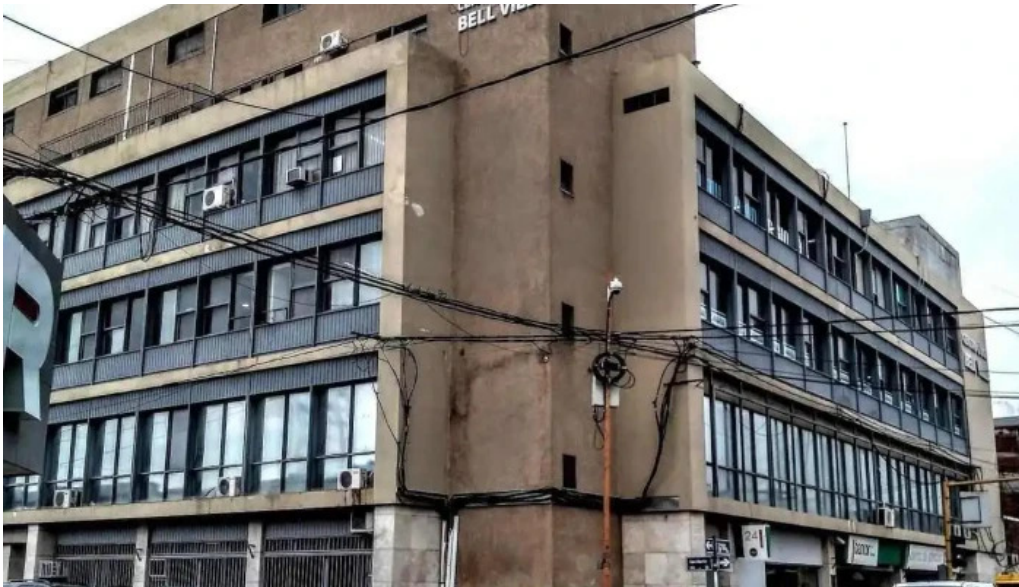
Banco de cordoba bell ville