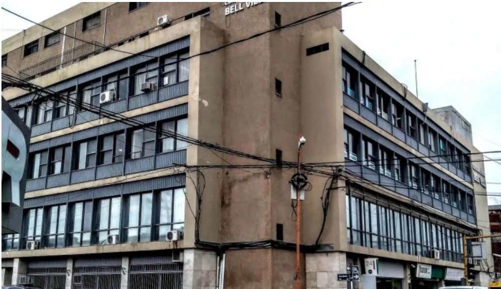
Banco de cordoba horario