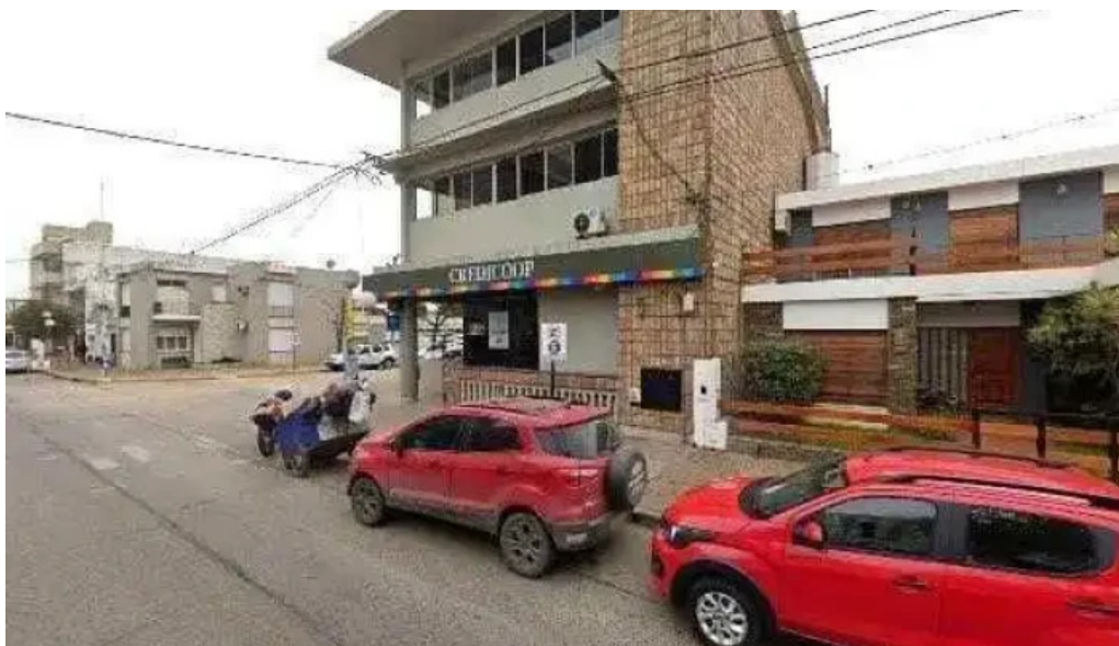
Mutual aginco a seco donde