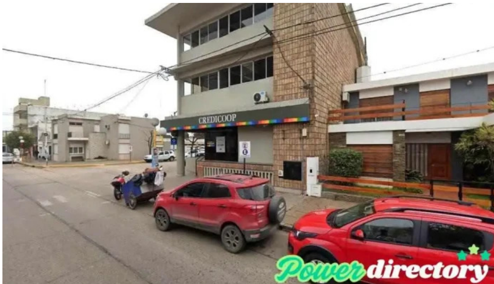
Mutual aginco a seco arroyo seco