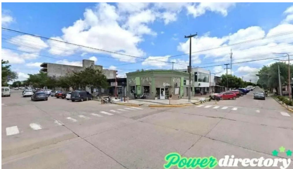
Banco macro armstrong