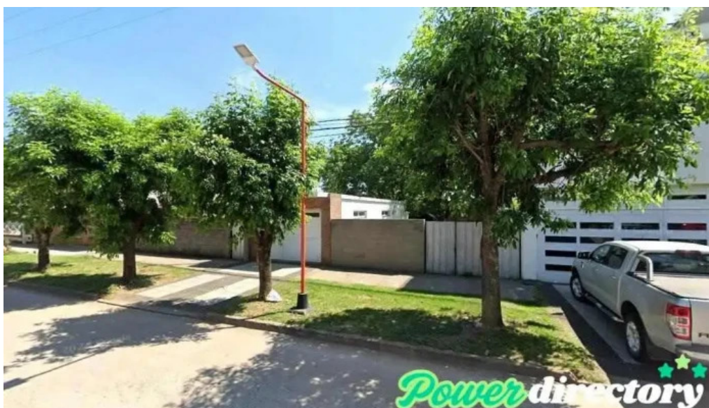
Banco de la nacion argentina armstrong