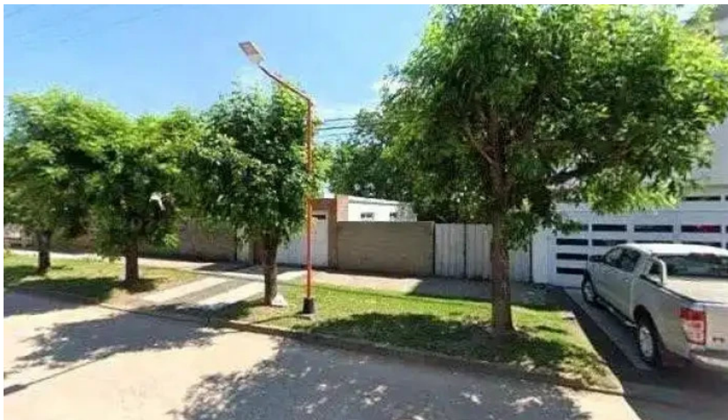
Banco de la nacion argentina horario