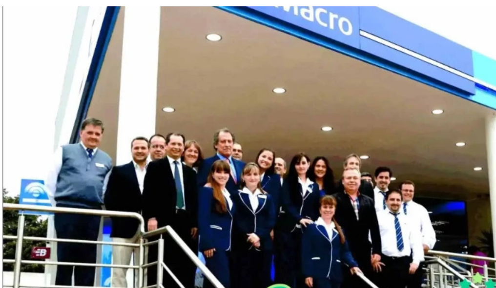
Banco macro sucursal 5 a del valle aristobulo del valle