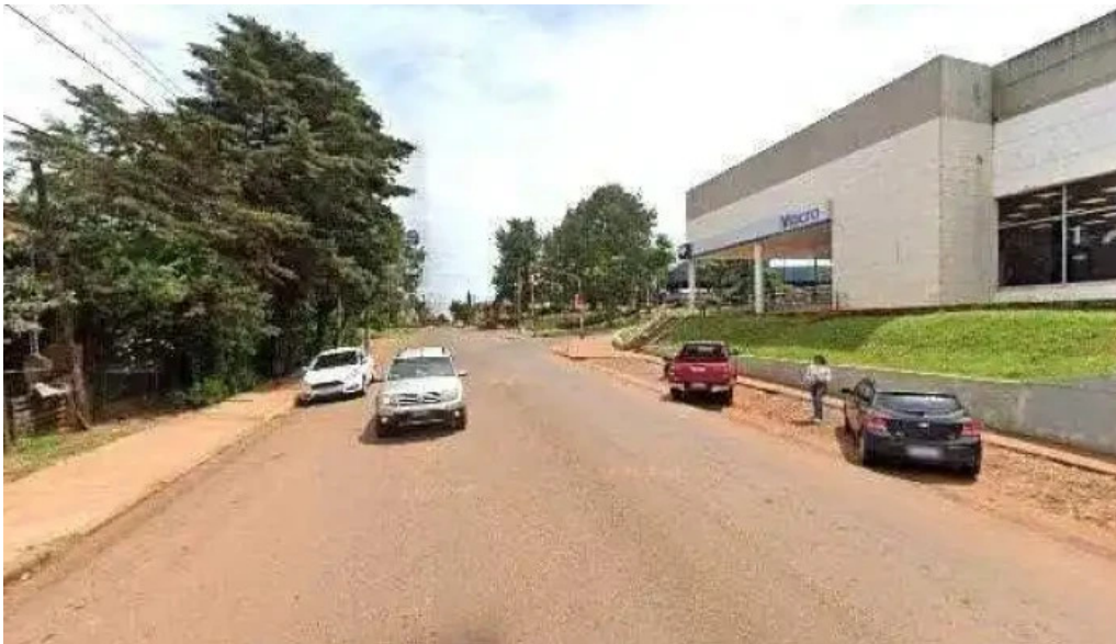
Banco macro sucursal 5 a del valle ubicacion