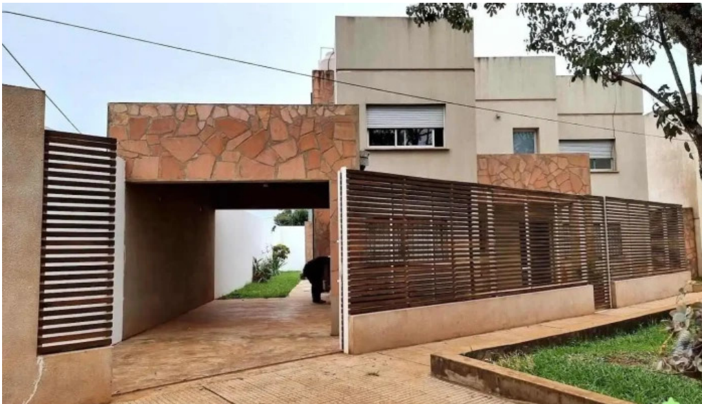
Banco de la nacion argentina aristobulo del valle