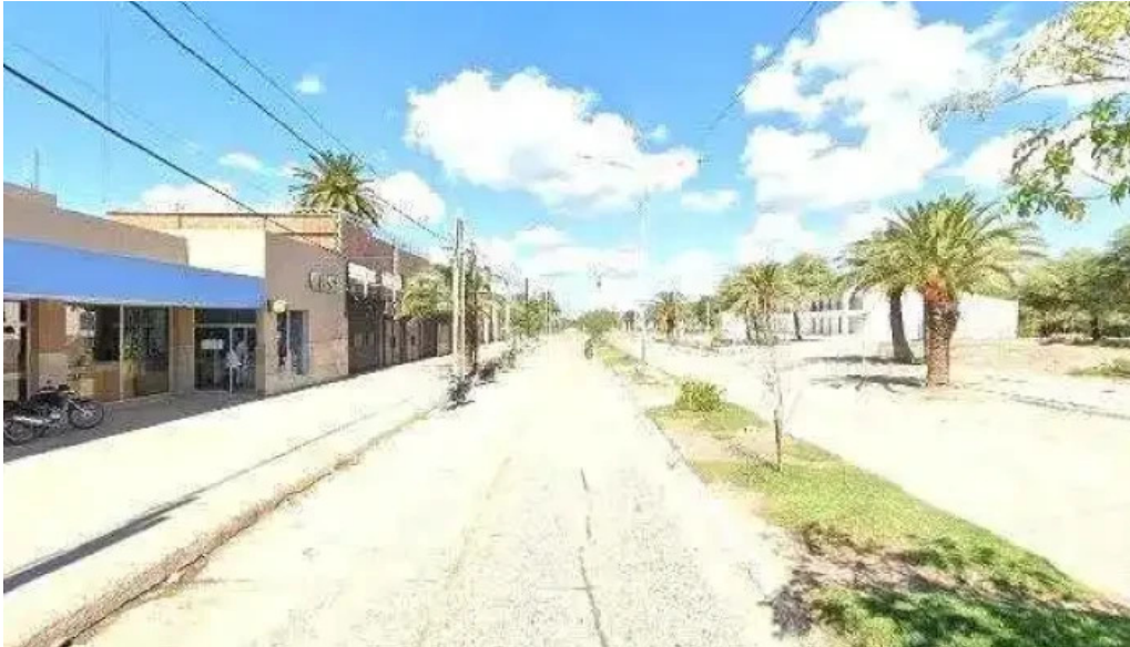
Banco santiago del estero sucursal anatuya cerca de mi