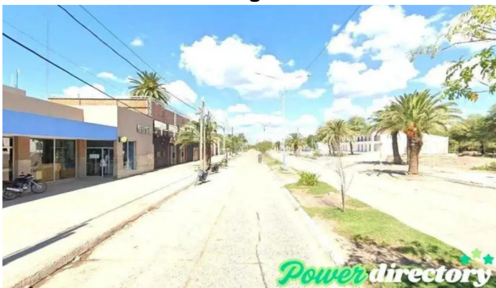
Banco santiago del estero sucursal anatura anatura