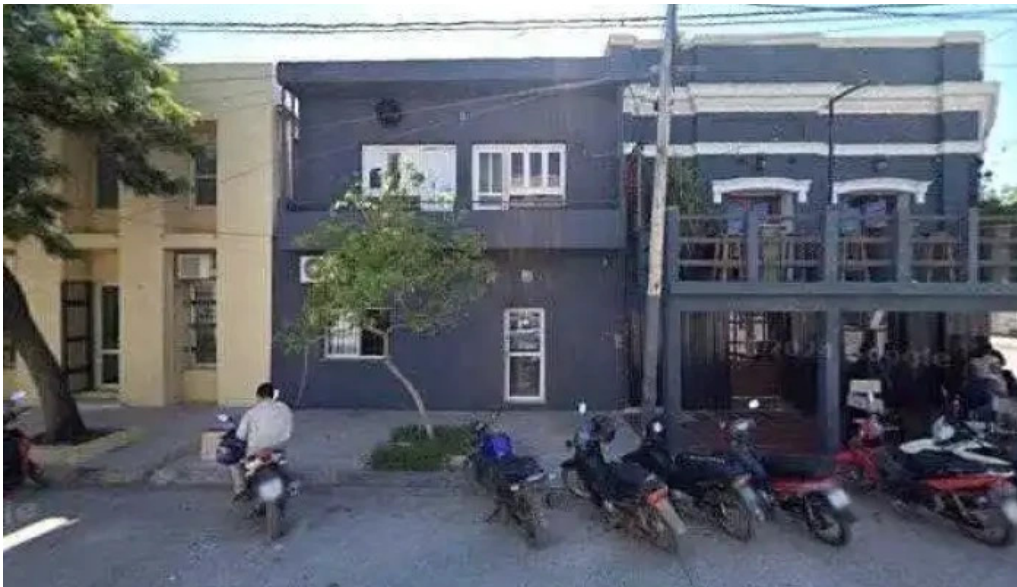
Banco de la nacion argentina zonadeg