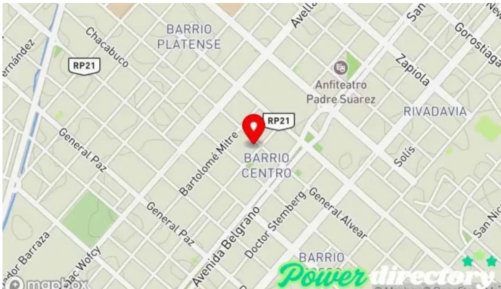
Banco de la nacion argentina mapa