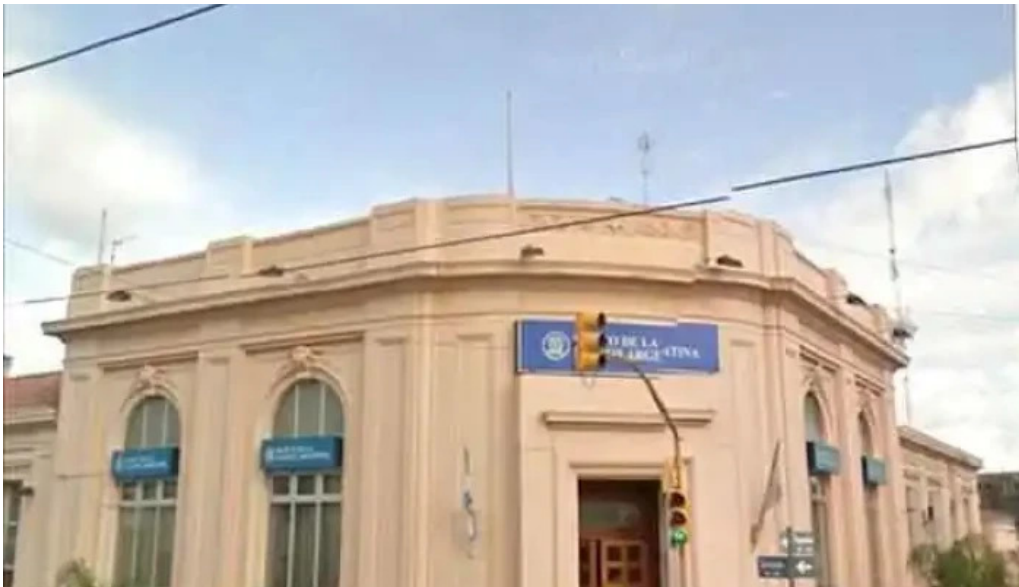
Banco de la nacion argentina anatumya