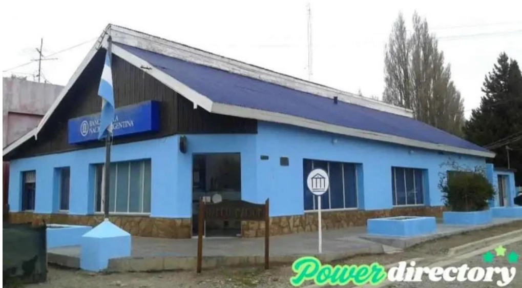
Banco de la nacion argentina alto rio senguer