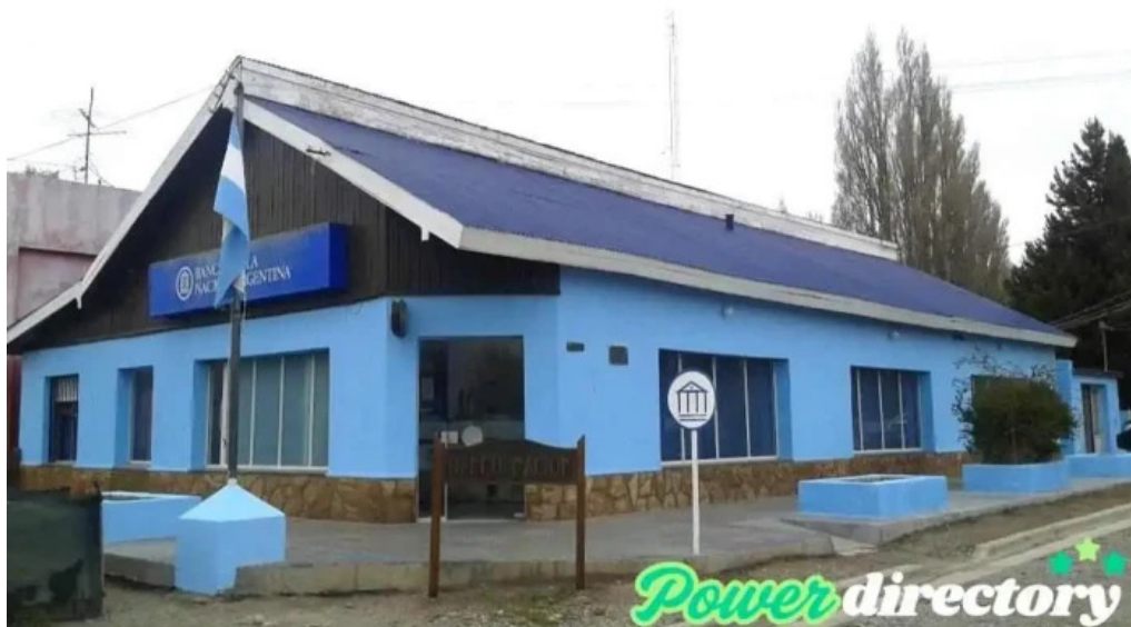
Banco de la nacion argentina ubicacion