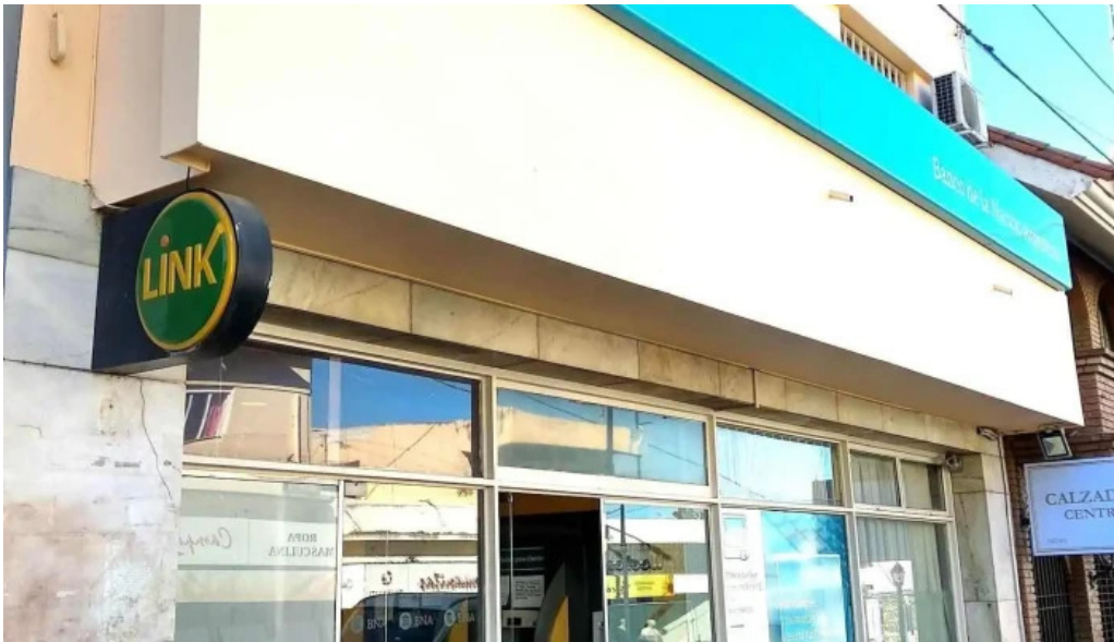
Banco de la nacion argentina exterior