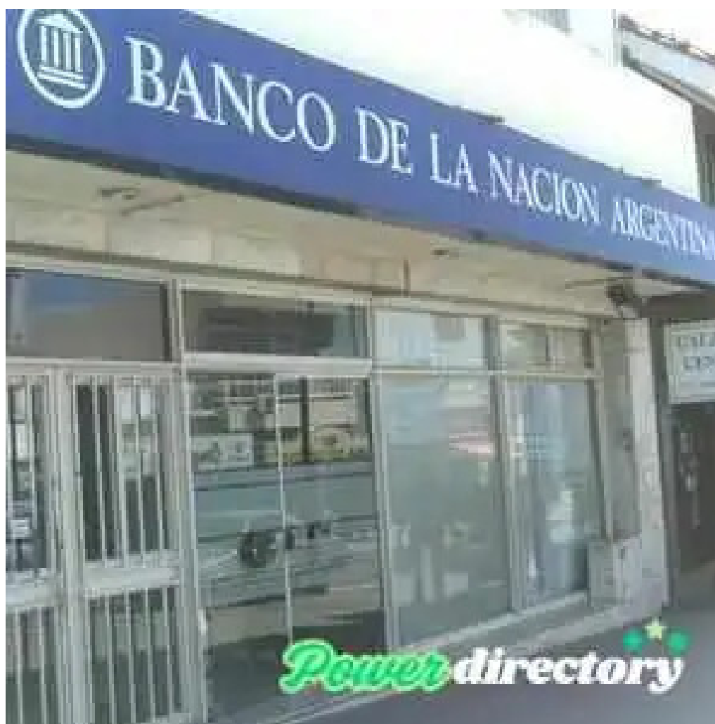
Banco de la nacion argentina alta gracia