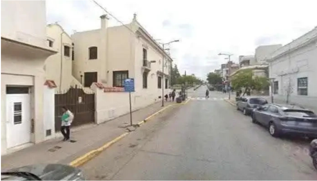
Banco de la nacion argentina fotos