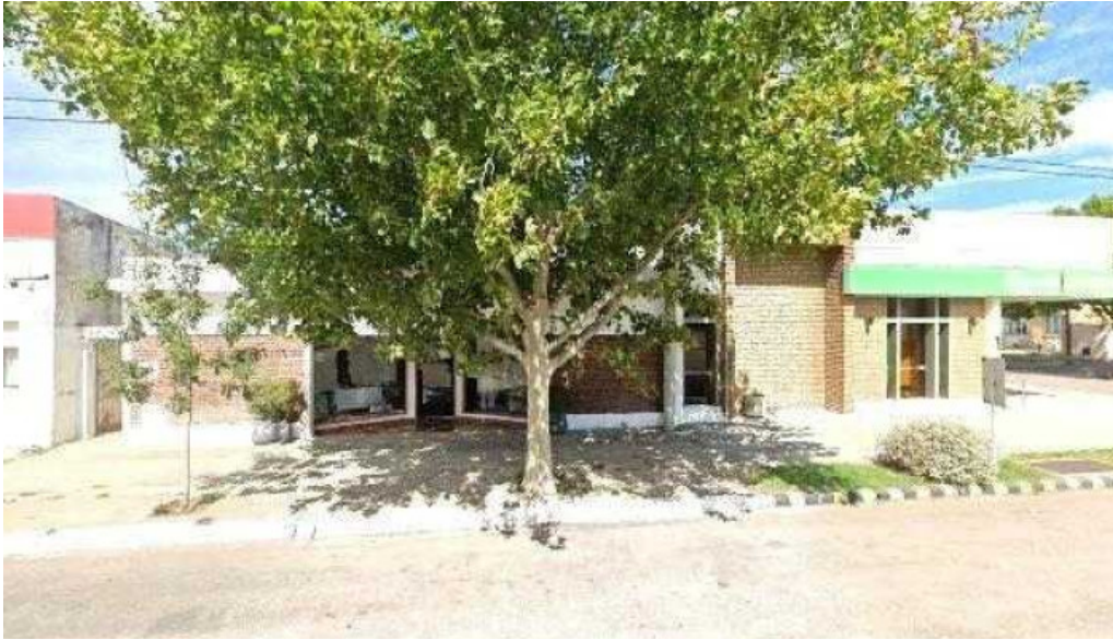
Banco de la pampa opiniones