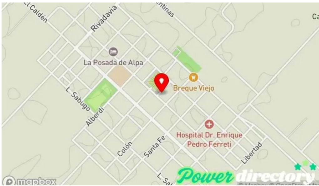
Banco de la pampa mapa