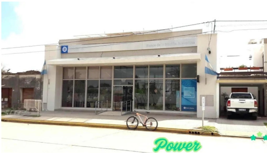
Banco de la nacion argentina alejandro roca