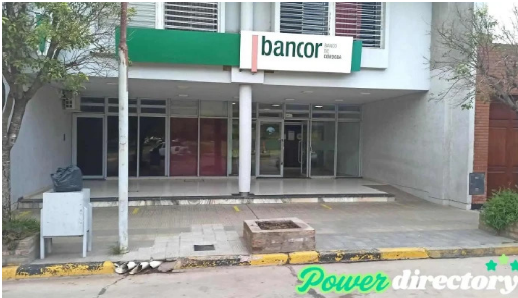
Banco de la provincia de cordoba adelia maria

Banco de la provincia de cordoba instagram