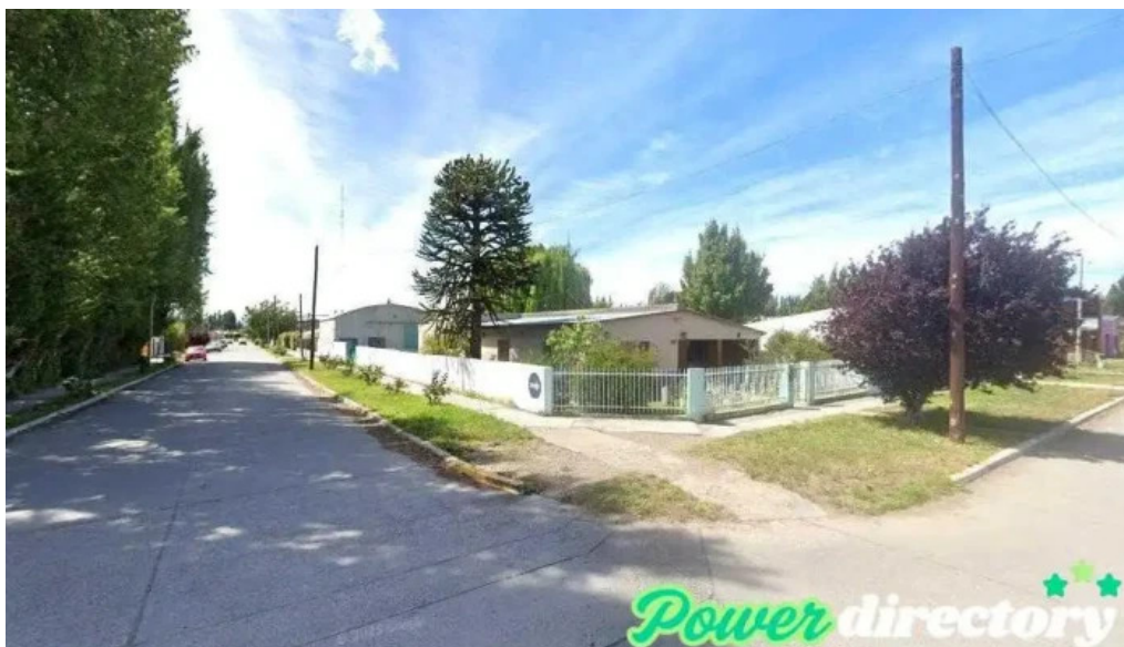
Banco patagonia los antiguos los antiguos