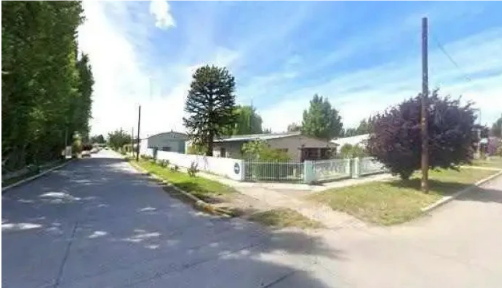
Banco patagonia los antiguos promocion