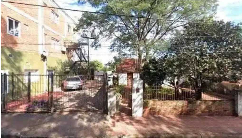
Red mutual la chacra zona