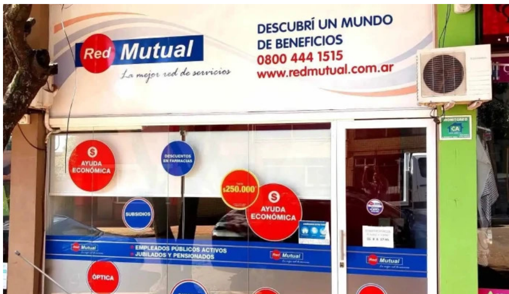
Red mutual la chacra del propietario