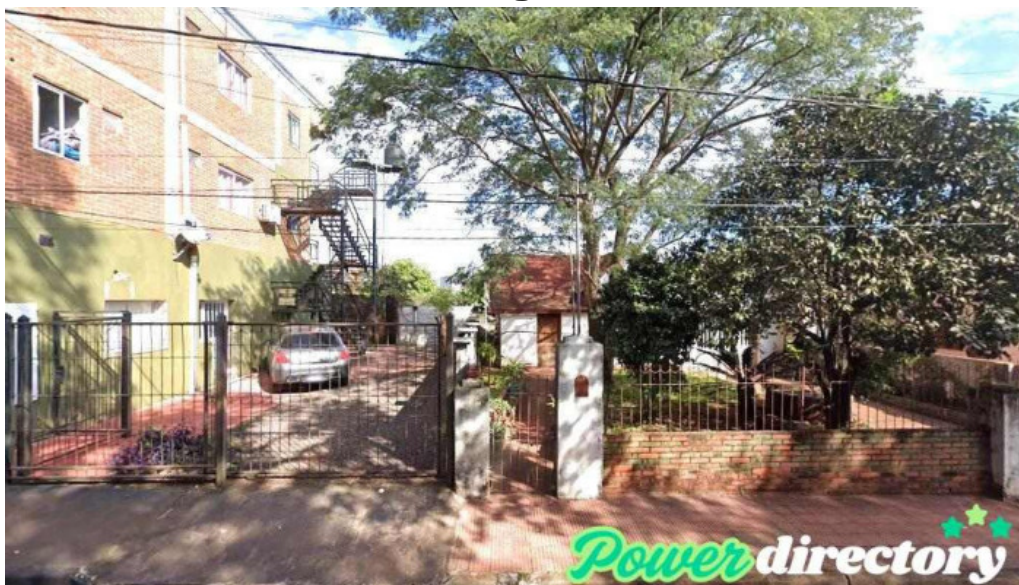
Red mutual la chacra obero