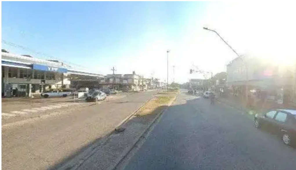
Red mutual fotosdeg