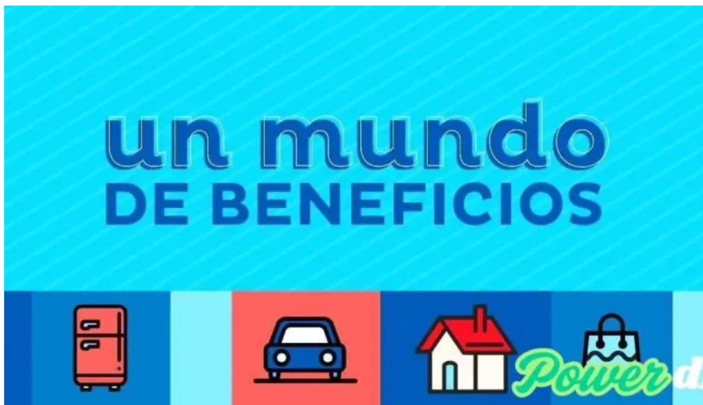
Red mutual del propietario