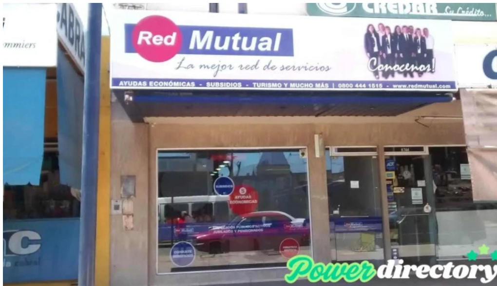
Red mutual ftn