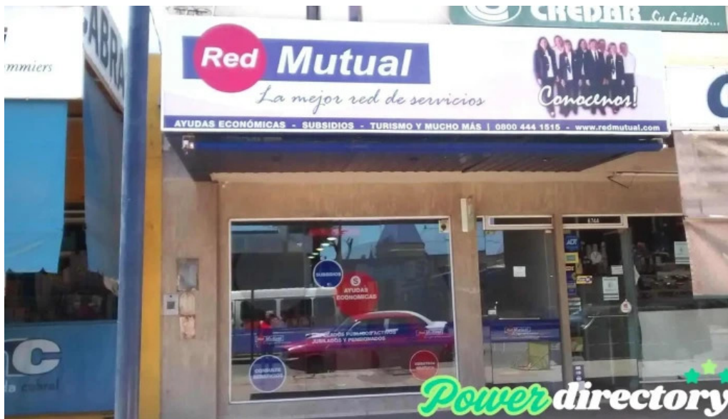
Red mutual fotos