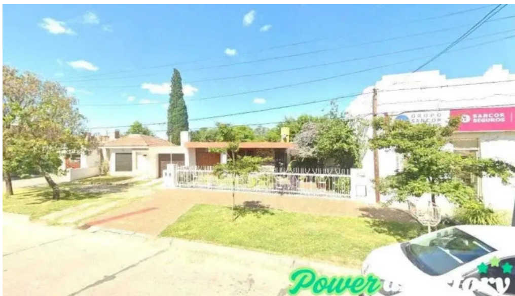
Asociacion mutual bell bell ville