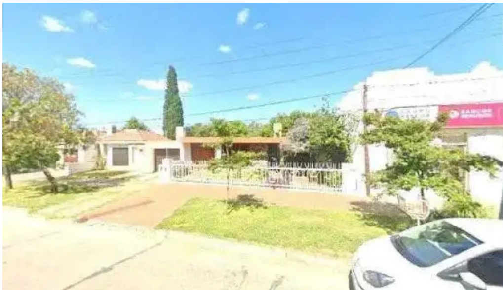
Asociacion mutual bell catalogo