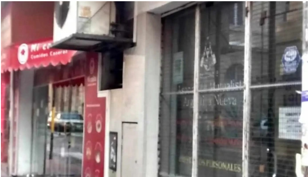
Asociacion mutualista argentina nueva direccion