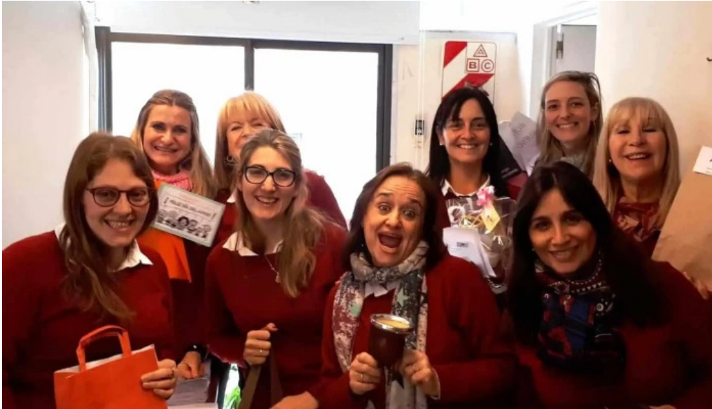
Asociacion mutualista argentina nueva cordoba