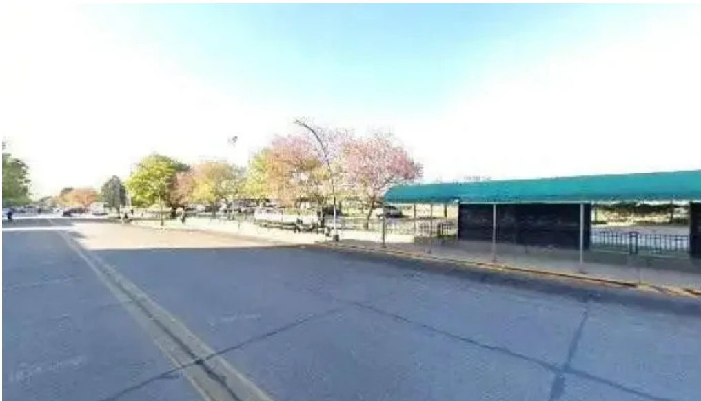
Todo creditos precios