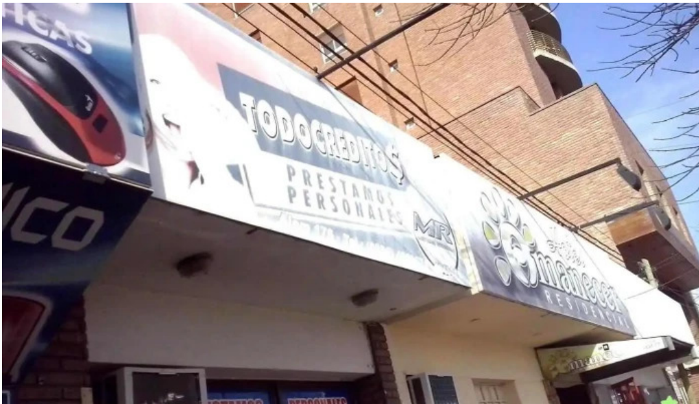
Todo creditos villa maria