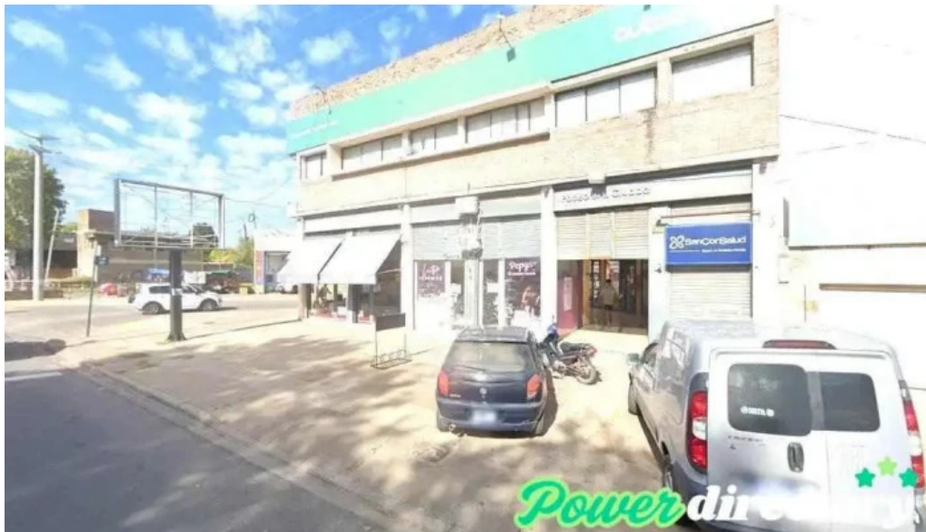
Autocredito agencia oficial villa gobernador galvez villa gdor galvez