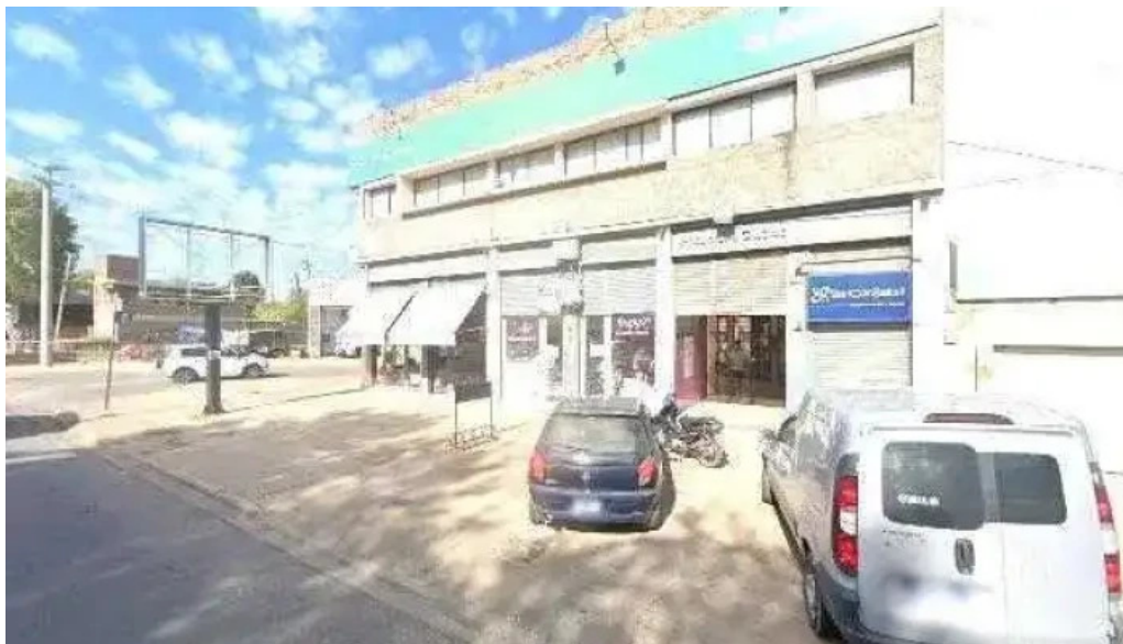
Autocredito agencia oficial villa gobernador galvez comentarios