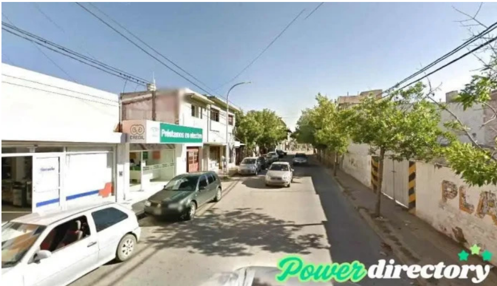
Prestamos villa dolores