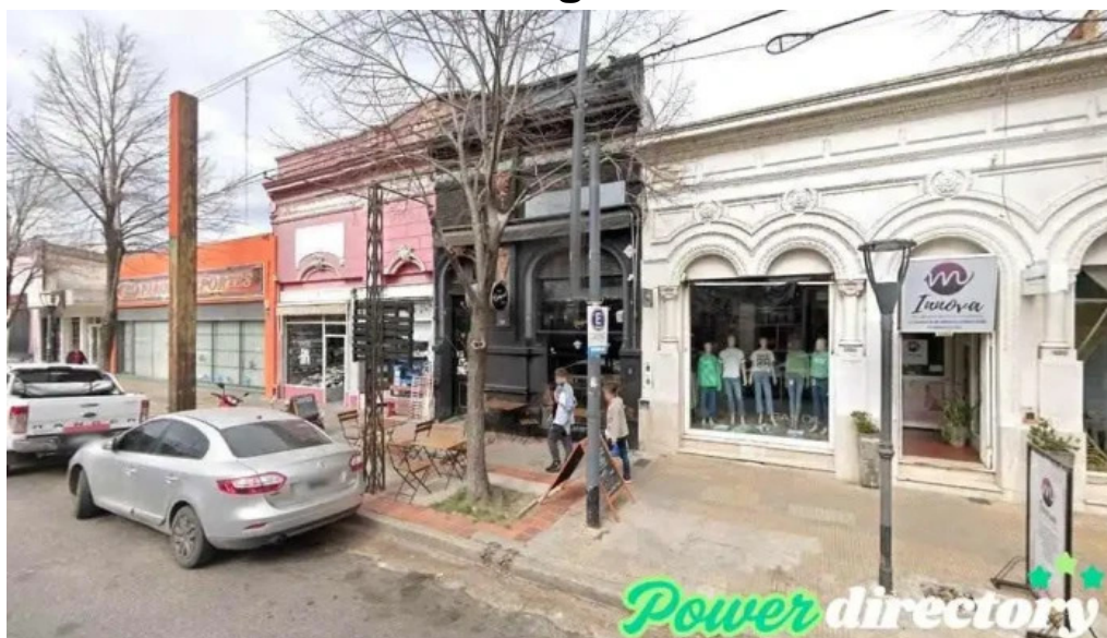
Mutual savio villa constitucion