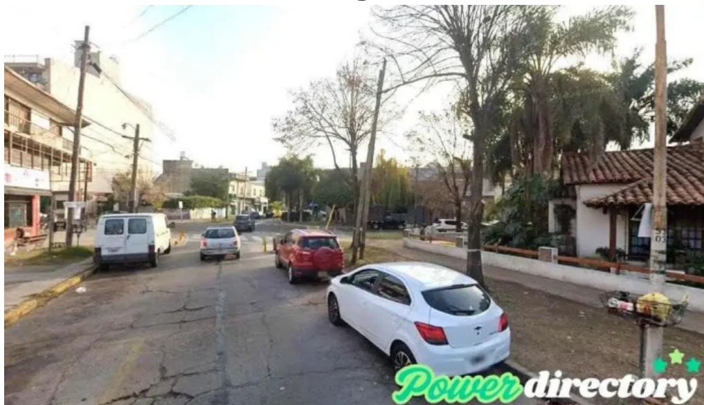
Prestamos personales villa bosch