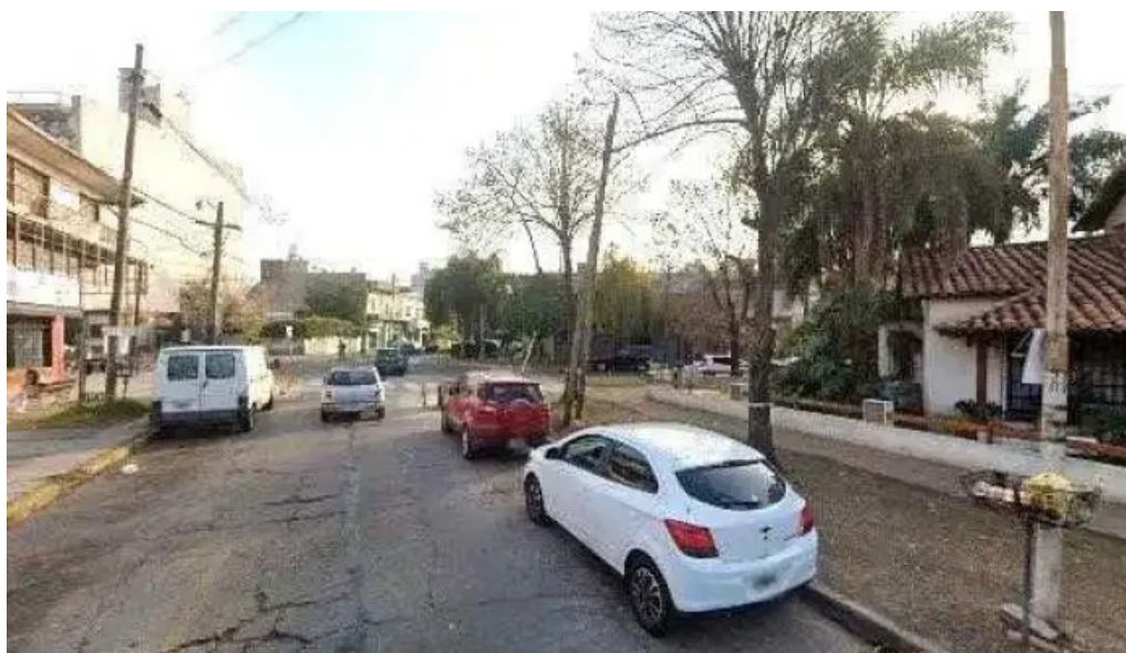
Prestamos personales sitio web