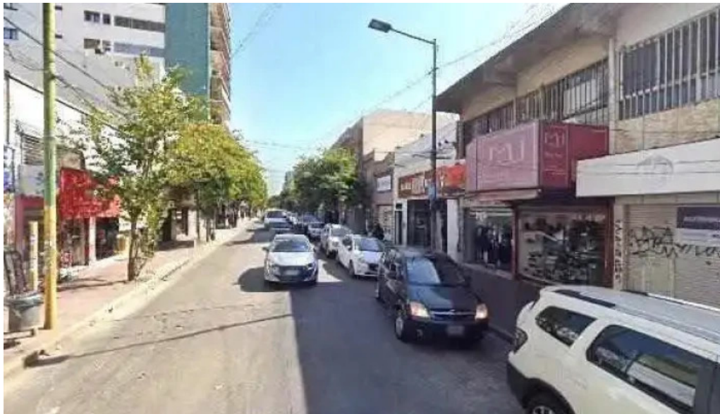
Credito ya del litoral numerodeg