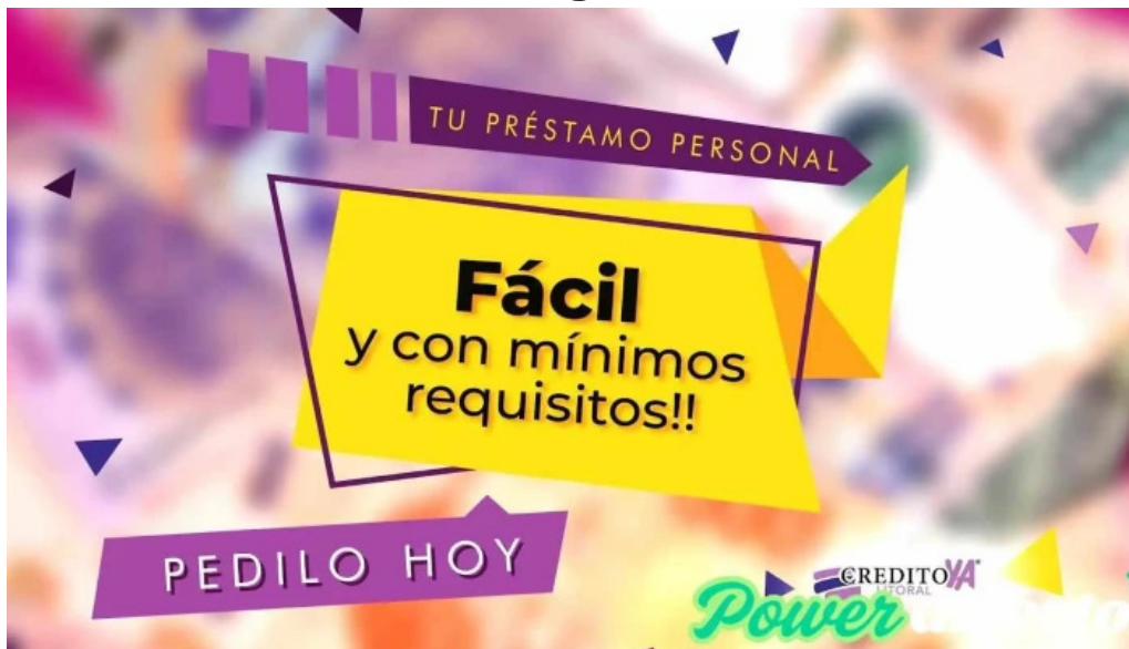
Credito ya del litoral villa ballester