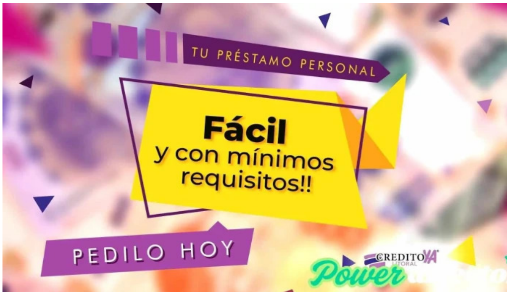
Credito ya del litoral numero