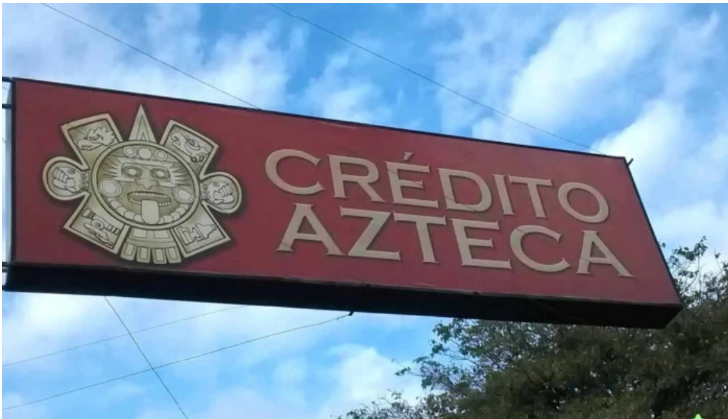
Credito azteca cerca de mi