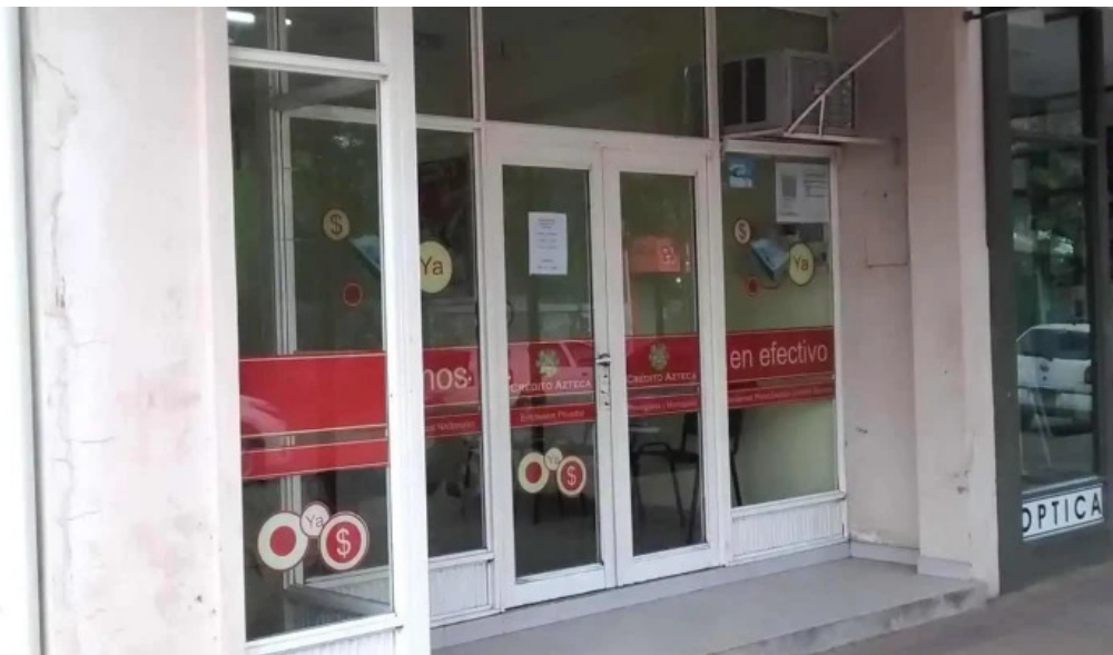
Credito azteca exterior