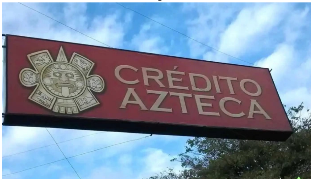
Credito azteca villa angela