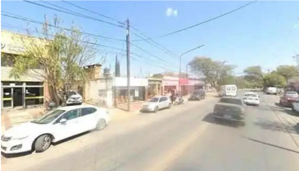
Efectivo en el acto donde